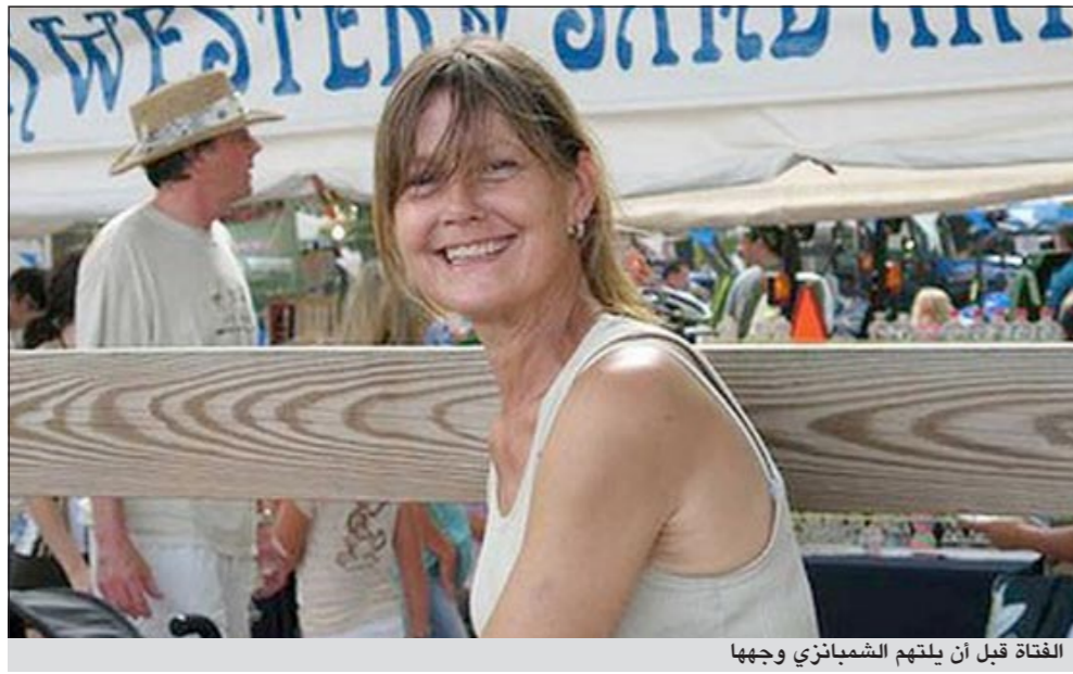
الفتاة قبل أن يلتهم الشمبانزي وجوها