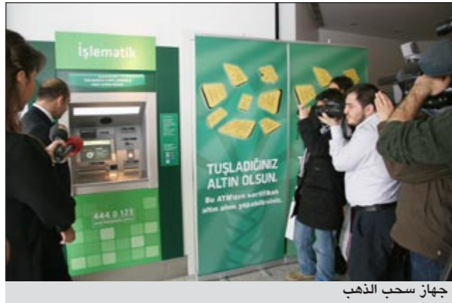
جهاز سحب الذهب

وتساهم الخدمة في توسعة قاعدة عملاء «بيتك - تركيا»، حيث بات التنافس المشروع بين البنوك لتوسعة قاعدة عملائها رهناً بما تطلقه من خدمات ومنتجات مبتكرة وبمستوى الجودة التي تقدم بها هذه الخدمات والمنتجات، كما ستعزز تلك المبادرة من سمعة ورصيد البنك عالمياً كمؤسسة مصرفية قادرة على الخروج من نطاق الخدمات المعتادة، وتدشين مجموعة من المنتجات غير المسبوقة.