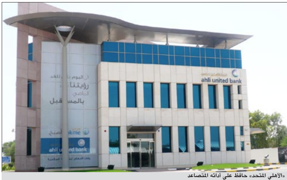
«الأهلي المتحد» حافظ على أدائه التصاعدي

وانخفضت محفظة القروض بنسبة بلغت نحو 0,9٪ أي بما يعادل 15,2 مليون دينار ليصل