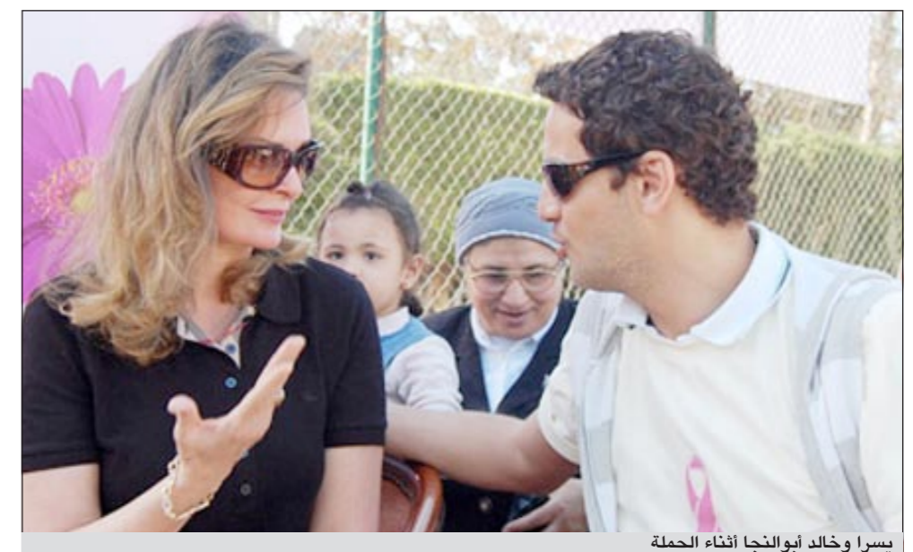
يسرا وخالد أبوالنجا أثناء الحملة

الذاتي للذدي أو باقي الفحوص بشكل روتيني منتظم، وتحدثت أيضا عن دورها في توعية المرأة بالمرض باعتبارها فنانة تلعب دورا اجتماعيا وإنسانيا، وأشارت إلى أهمية الفن في توعية السيدات بالمرض وبماهيته.