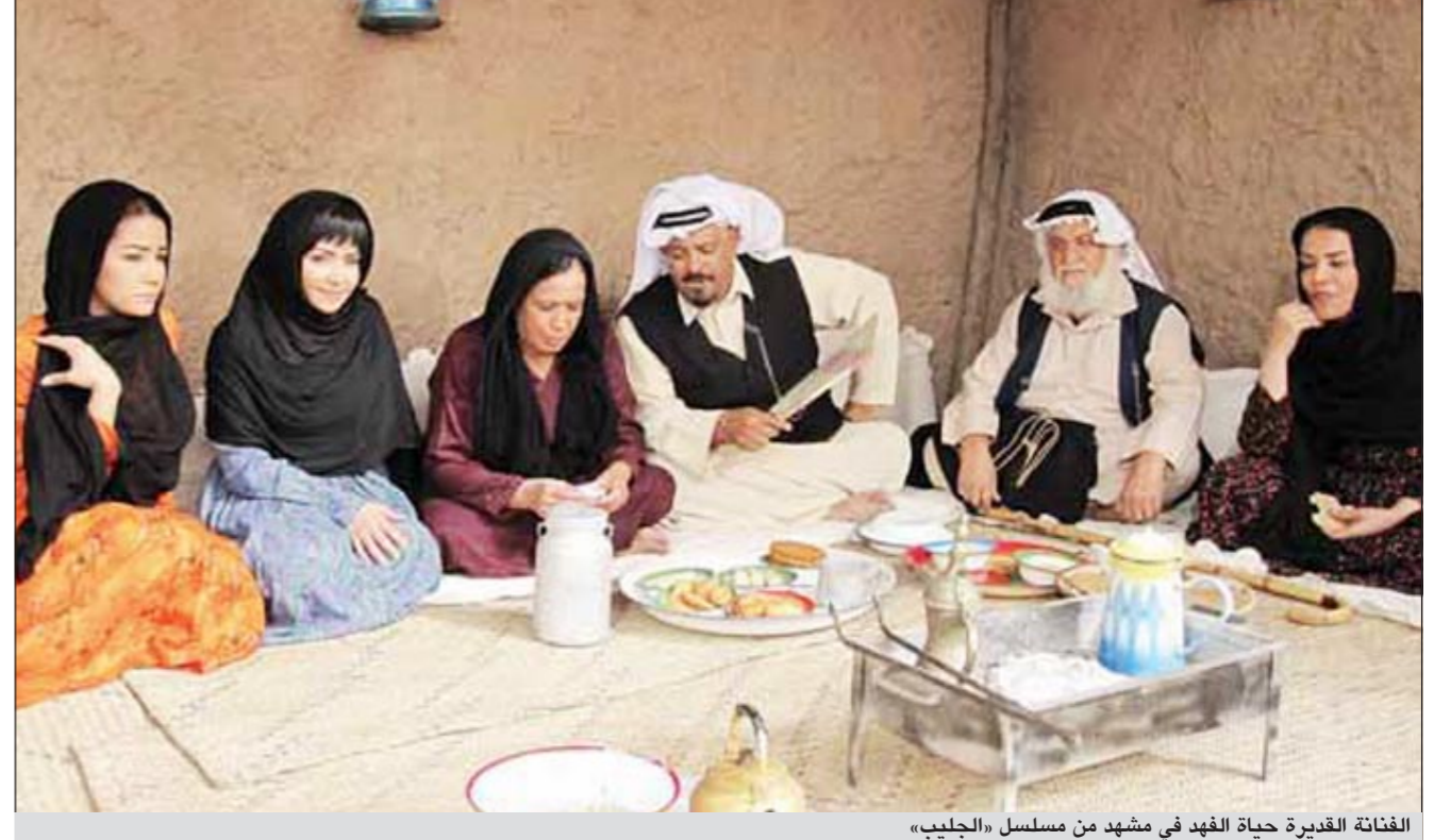
الفنّانة القديرة حياة الفهد في مشهد من مسلسل «الجليب»