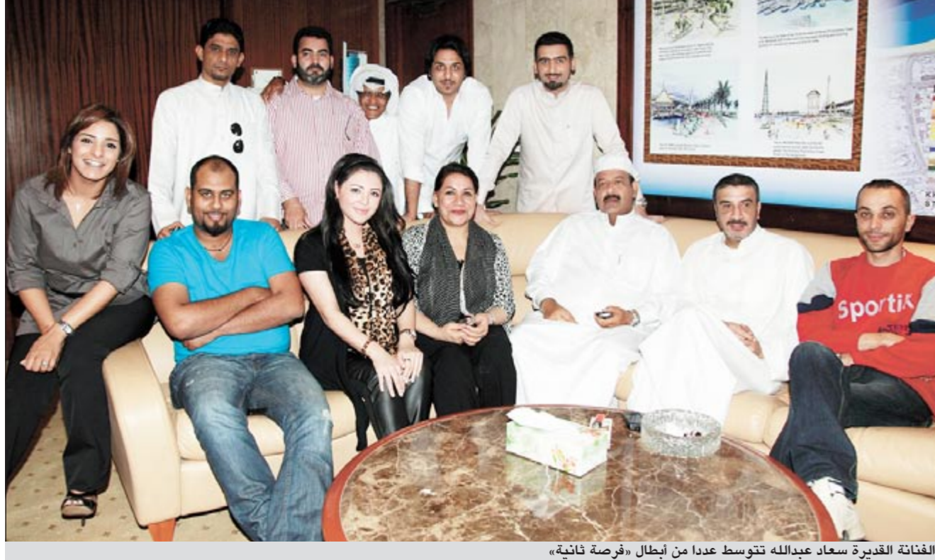
الفنّانة القديرة سعاد عبدالله تتوسط عددا من أبطال «فرصة ثانية»