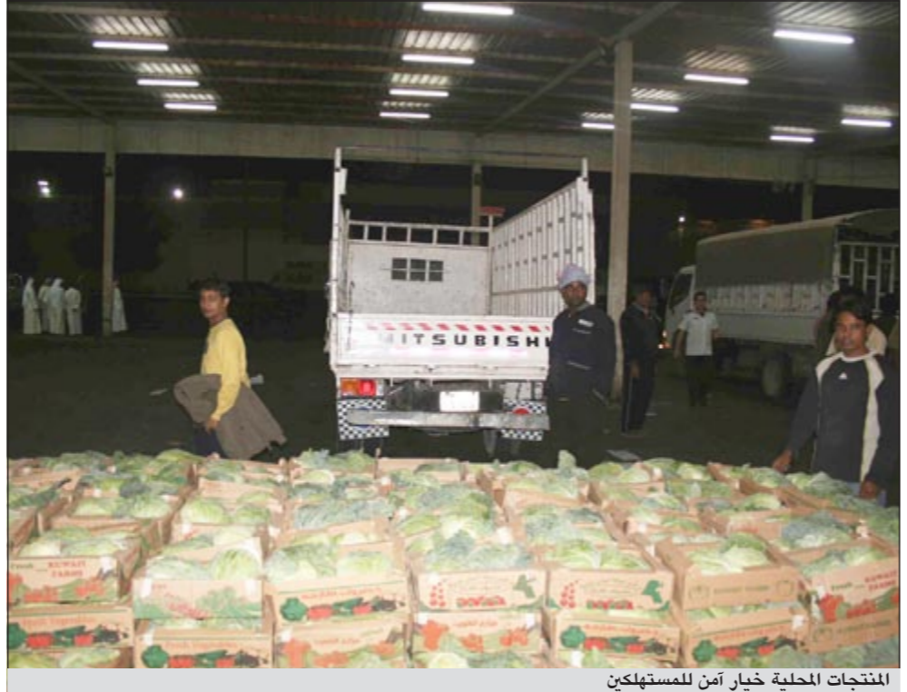
المنتجات المحلية خيار آمن للمستهلكين