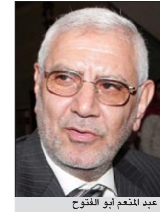
عبد المنعم أبو الفتوح

بالأساس إلى نشر أكاذيب خلال الحملة الانتخابية تسيء إلى صورته واسمه كمرشح لرئاسة الجمهورية. وتعرض أبو الفتوح إلى عاصفة من الهجوم العنيف اثر نشر المقابلة على نطاق واسع عبر شبكات الانترنت. وعرض التلفزيون في نفس الشريط مقابلة أيضا مع مرشد جماعة الإخوان المسلمين السابق في سورية علي البجانوني