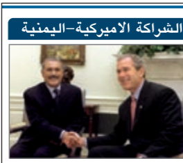
بونو وصالح يتصافحان في

وأضاف النائب المعارض «إن دعا الإسراع في اتخاذ مثل ذلك الإجراء سيؤدي إلى سلوك الطريق الآخر المتمثل في التصامد مع النظام والانزلاق في أتون حرب أهلية على النحو الذي يريده الرئيس صالح».