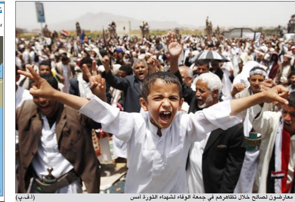
معارضون لصالح خلال تظاهريهم في جمعة الوفاء لشهداء الثورة أمس

من المسؤولين بالنظام الحالي في هذه الحكومة. في إطار هذا الحد، يرفض البعض مشاركة أي من هؤلاء الأعضاء، بينما يرى آخرون إمكانية مشاركة العناصر والأعضاء الذين لم يتورطوا في أعمال فساد أو في جرائم ارتكبت في حق الدولة أو ضد المعتصمين المناهضين للنظام، ومن المرجح أن يلقي الطرح الثاني قبولا في حالة نجاح الثوار في تحقيق مطالبهم. في سياق متصل، ذكرت مصادر بالمعارضة اليمنية، أن هناك تشاورا مكثفا حاليا بين «تحالف أحزاب اللقاء المشترك» (المعارضة الرئيسية باليمن) من جهة وبين المعارضة الشبابية (ثورة الشباب السلمية) من