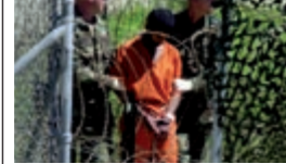
يشكل الممتنون المجموعة الكبرى من المتحجزين في سجن غوانتانامو في كوبا

27 نوفمبر 2009 اليمن تتعهد بمحاربة الإرهاب بعد اعتداءات الـ 10 سبتمبر صنعا تسلم 200 مليون دولار سبوتيا من واشنطن كمساعدات في مجال الدفاع والتنمية