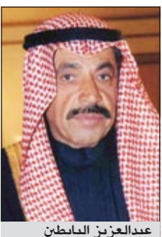
عبد العزيز البابطين

فيرونا (إيطاليا) - كونا: وصل الشاعر العربي الكبير عبد العزيز سعود البابطين إلى مدينة فيرونا الإيطالية مساء أمس لحضور احتفال تكريمه بأرملة المدينة الحاضرة الشهيرة للفنون والموسيقى وبجائزة الأكاديمية العالمية للشعر في مستهل مهرجان مهم.