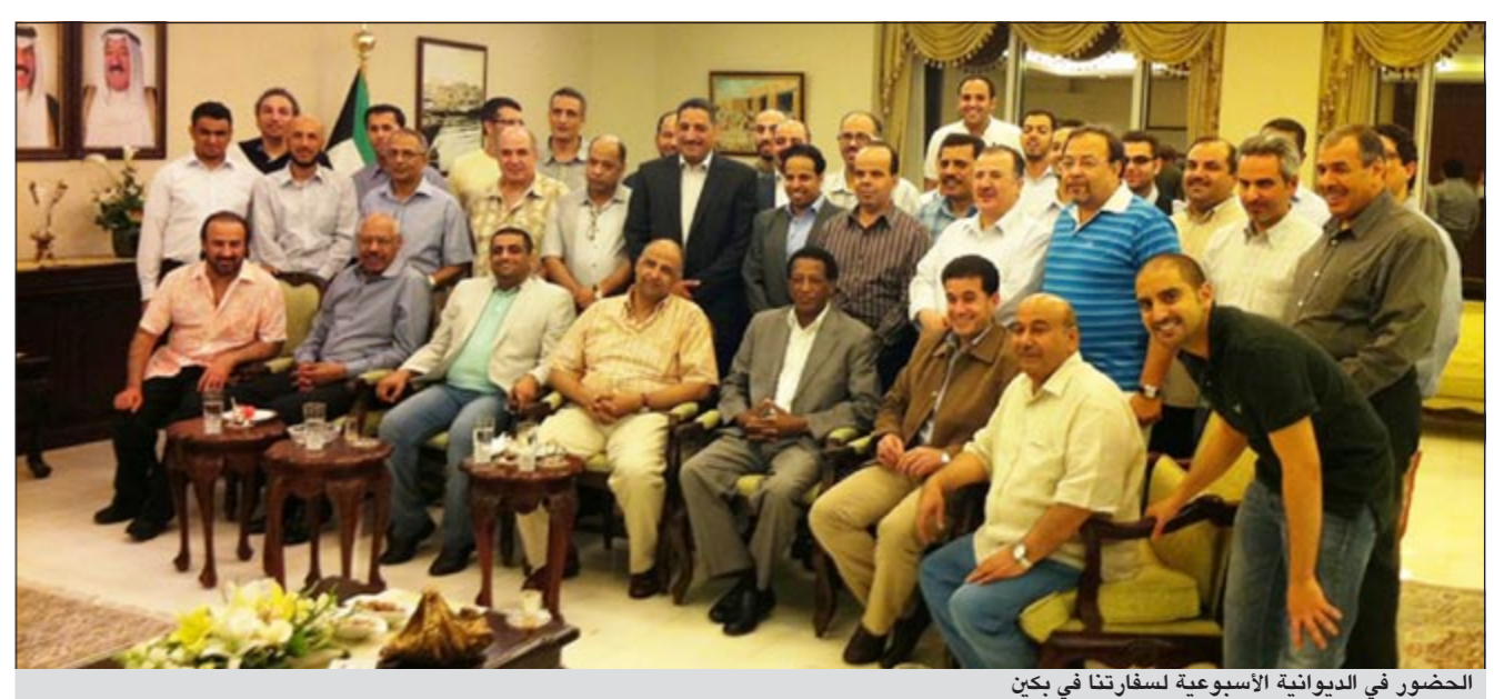
الحضور في الديوانية الأسبوعية لسفارتنا في بكيين

بكيين - كونا: أشاد المركز العربي للمعلومات الذي يعني بالعلاقات الصينية - العربية بفكرة الديوانية الأسبوعية التي تنظمها سفارتنا لدى بكيين لتعزيز العلاقات الاجتماعية والاقتصادية والإعلامية بين العرب والصينيين. وذكر بيان صحفي لسفارتنا لدى الصين امس ان اشادة المركز تأتي ضمن اشادات وسائل الإعلام الصينية بفكرة ديوانية الكويت في بكيين، حيث اعتبرتها مناسبة اجتماعية متناصلة في المجتمع الكويتي للتواصل وتعزيز الألفة وتبادل الآراء حول مختلف القضايا. ونقل البيان عن المركز العربي للمعلومات الذي يعني بالعلاقات الصينية - العربية بفكرة الديوانية الأسبوعية التي تنظمها سفارتنا لدى بكيين، حيث اعتبرتها مناسبة اجتماعية متناصلة في المجتمع الكويتي للتواصل وتعزيز الألفة وتبادل الآراء حول مختلف القضايا. ونقل البيان عن المركز العربي للمعلومات الذي يعني بالعلاقات الصينية - العربية بفكرة الديوانية الأسبوعية التي تنظمها سفارتنا لدى بكيين، حيث اعتبرتها مناسبة اجتماعية متناصلة في المجتمع الكويتي للتواصل وتعزيز الألفة وتبادل الآراء حول مختلف القضايا.