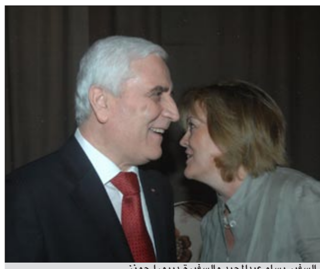
السفير بسام عبدالمجيد والسفيرة ديبورا جونز

خور عبدالله أو القناة المائية، مؤكداً أن الأمور بينهم وبين العراقيين تسير في الاتجاه الصحيح. أما بخصوص ضعف نسبة الاستثمار الروسي في الكويت وكذلك التبادل التجاري قال