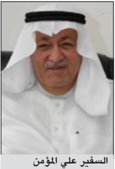
السفير علي المؤمن

تقدم سفيرنا في العراق علي المؤمن بالشكر والتقدير لوزارة الأوقاف على تبرعها بـ 1100 كرسي للمعاقين إلى جمعية المعاقين العراقية نظراً لشعورهم الطيب نحو الكويت ومشاركتهم السفارة في إقامة احتفالات العيد الوطني في بغداد، وكذلك شكر جمعية المكفوفين الكويتية على حسن الاستقبال والتقدير من قبل رئيسها وتفضلهم للمشاركة والتبرع بطباعة 1000 مصحف لجمعية المكفوفين العراقية ومن المتوقع إنجاز هذه الأعمال خلال شهر رمضان المبارك، كما شكر المؤمن كل من ساهم وتبرع لهذا المشروع.