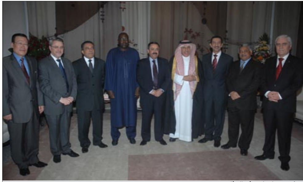
حضور دبلوماسي في الحفل

استمرت بيننا وبينهم والزيارات كذلك سواء من قبل الجانب الكويتي إلى موسكو أو من قبل الروس إلى الكويت. من جهته، رد السفير الروسي في الكويت الكسندر كينشاك على سؤال حول رفض روسيا لإقرار مشروع قرار في مجلس الأمن يدين الأحداث في سورية قائلاً إن روسيا لا يمكنها اتخاذ أي قرار يدين سورية في الظروف الحالية. أما عما يمكن أن تفعله روسيا في ظل التهديد الأميركي والأوروبي بفرض عقوبات على أفراد في سورية فقال «إذا أراد الاتحاد الأوروبي فرض عقوبات فهذا حقهم ولكل دولة سيادتها ولها الحق أن تمارس ما تراه مناسباً». وبخصوص الاحتفال بالعيد الوطني قال نحن اتخذنا من تاريخ عام 1991 للاحتفال بالعيد الوطني لأن في هذا التاريخ صوت البرلمان الروسي من أجل السيادة الوطنية لروسية الاتحادية.