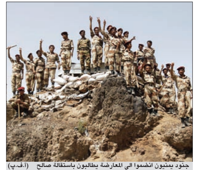
جنود يمنيون انضموا الى المعارضة يطالبون باستقالة صالح

صنعاء - وكالات: فيما يستمر الترقب لمصير الرئيس اليمني علي عبدالله صالح تظاهر عشرات الآلاف من مؤيديه ومعارضيه في صنعاء بساحة التغيير وميدان السبعين طالب المحتجون بعدم عودته من الرياض حيث يخضع للعلاج فيما دعا مؤيدوه الى محاكمة من قام بتدبير اغتياله. وطلب المحتجون في ساحة التغيير بجامعة صنعاء خلال مشاركتهم في جمعة «الوفاء للشهداء الثورة»، بعدم عودته وبسرعة تشكيل مجلس انتقالي تشارك فيه كل القوى السياسية بمن فيهم «ثورة الشباب السلمية» والقوى على الساحل الجنوبي والشمالية. وفي هذه الأثناء قال رئيس الوزراء اليمني السابق حيدر ابوبكر العطاس لـ «العربية» ان ما ظهر من نتائج الثورة حتى الآن يشجع على إعادة النظر في صياغة الوحدة على أساس فيدرالي بإقليمين ضمن دولة مدنية.