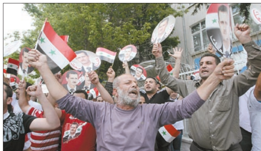
سوريون تظاهروا بتأييداً للاسد أمام السفارة السورية في انقره

عواصم - وكالات: تزامناً مع تجدد المظاهرات تحت عنوان «جمعة العشاير» في معظم المحافظات السورية أمس، استمر تدفق اللاجئين من جسر الشغور إلى تركيا وتجاوز عددهم 3000. وفيما تحدثت منظمات حقوقية عن مقتل أكثر من 28 شخصاً، أكد التلفزيون السوري ان الجيش يواصل «تطهير» القرى المحيطة بمنطقة جسر الشغور التابعة لادلب من «التنظيمات المسلحة» التي قامت بتفخيخ بعض المناطق ونشر عناصر مسلحة تم القاء القبض على عدد كبير منهم»