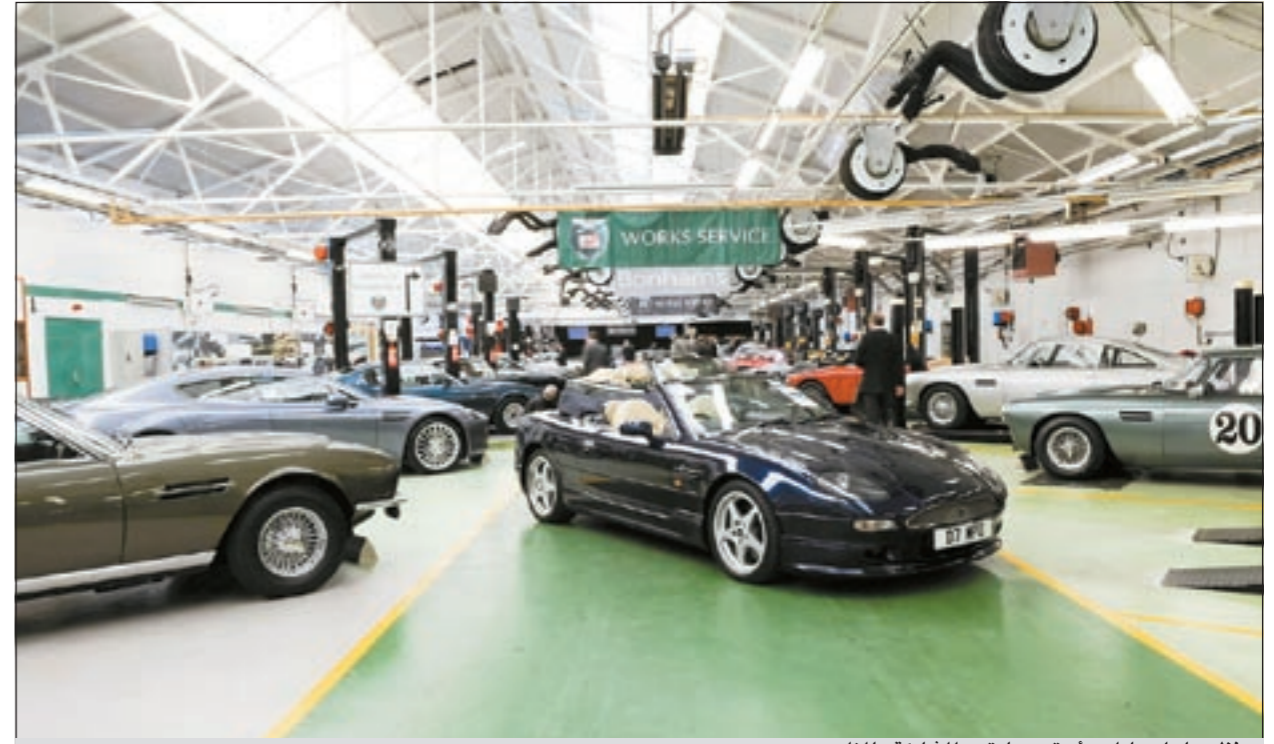
منظر عام لسيارت «أستون مارتين» المشاركة بالمزاد