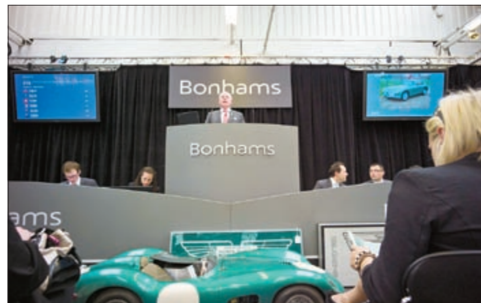
جانب من عملية المزاد التي تمت على السيارت

استضافت شركة «ويركس سيرفيس» التابعة لأستون مارتين يوم 21 مايو الجاري، مزادها الثاني عشر الأكثر نجاحا حتى الآن، والذي نظمه مؤسسة «بونهامز» لسيارت أستون مارتين الرياضية وطراز السيارت المتعلقة بها.