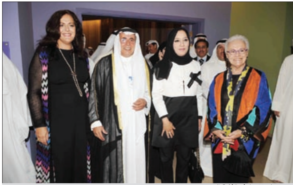
ديبورسلي تتجول في الفندق الجديد

عن سعادتها بأن اختيار مجموعة «ريزيدور» التي تعتبر واحدة من أكبر الشركات الفندقية في العالم على الكويت لإنشاء الفرع الثاني لفنادق ميسوني فيها.