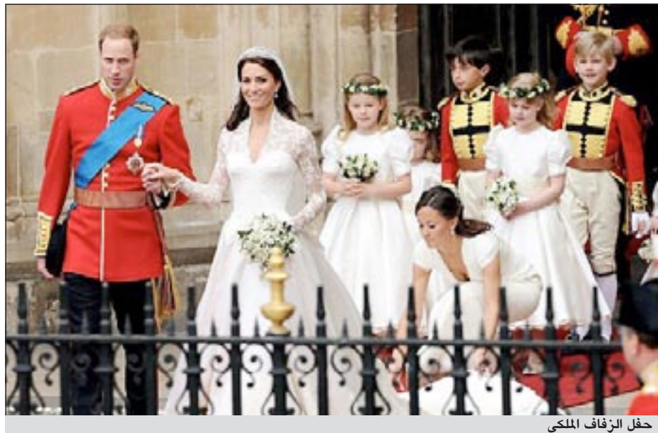
حفل الزفاف الملكي

ومع استبعاد الوقود استقرت المبيعات خلال الفترة دون تغير يذكر. ويتوقع خبراء الاقتصاد أن يتعرض إنفاق المستهلكين لضغوط خلال العام الحالي إذ إن ارتفاع التضخم وضعف نمو الأجور يشكلان ضغطاً على دخول الأسر.