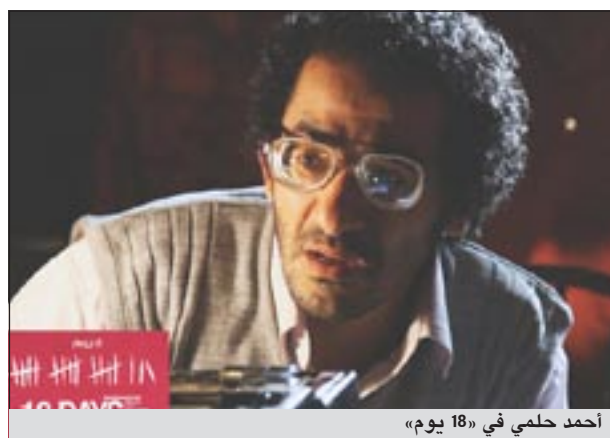
احمد حلمي في «18 يوم»

وحضر من النجوم المصريين الذين شاركوا في الفيلم كل من يسرا ومنى زكي واحمد حلمي وأسر ياسين وخالد ابو النجا ومعظمهم كانوا من الناشطين الفعليين على الأرض خلال الثورة وشاركوا في تظاهراتها يومياً وكذلك مخرجو الشريط الذين حضر منهم إلى كان يسري نصرالله وكاملة ابو ذكري ومروان حامد وشريف البداري ومريم ابوعوف.