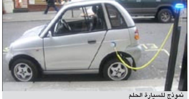
نموذج للسيارة الحلم

كما أنها متفائلة بإعادة ألمانيا كسب الأرض التي خسرتها في