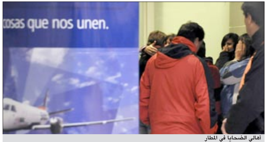
أهالي الضحايا في المطار

بوينوس ايرس - أ.ف. ب: تحطمت طائرة لشركة الطيران الأذربيجانية الخاصة «صول» مساء الأربعاء في منطقة بتاغونيا الصحراوية (جنوب) ما أسفر عن مقتل كل الأشخاص الـ 22 الذين كانوا على متنها، كما أبادت الشركة.