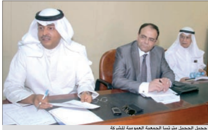
جحيل مقررًا الجمعية العمومية للشركة

المحلقة بمدينة صباح السالم الجامعية. واختتم الجحيل تصريحاته قائلا: «سنبقى على نفس النهج وتوجهات العم ناصر الخرافي رحمه الله وعلى نفس الخطوات السابقة».