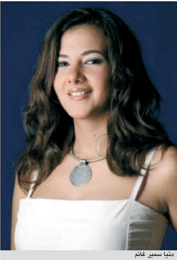
دنيا سمير غانم

رغم انتشار حساب باسمها على «تويتر» ووصول عدد متابعيه إلى أكثر من خمسة عشر ألف متابع، إلا ان الممثلة المصرية دنيا سمير غانم نفت أنها تمتلك أي حساب شخصي على موقعي التواصل الاجتماعي «الفيس بوك» و«التويتر»، مؤكدة أن أي حساب يحمل اسمها هو حساب مزيف.