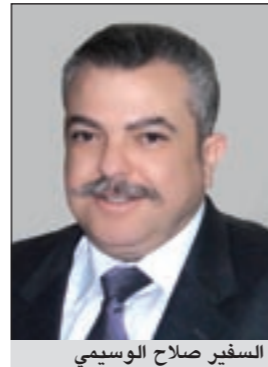
السفير صلاح الوسيمي

كويتا: أكد القنصل المصري العام لدى الكويت السفير صلاح الوسيمي حرص المستثمرين الكويتيين على دعم الاقتصاد المصري والاستفادة من الفرص الاستثمارية الواعدة في مصر المتاحة في الوقت الراهن. وقال الوسيمي ان هناك مجموعات مالية كويتية عملاقة ابدت رغبتها في تأسيس شركات مشتركة بينها وبين رجال أعمال مصريين ولقائمة مشاريع زراعية وصناعية للمساهمة في دفع عجلة الاقتصاد المصري وتحقيق عوائد مالية مجزية لاستثماراتهم. وأشاد بإعطاء صاحب السمو الأمير الؤء الاضمر للجانب المصري بان الكويت ستدعم الاقتصاد المصري للخروج من ازمته، مبيناً ان هذا الدعم الكويتي ظهر في تدفقات مالية عن طريق قروض منخفضة الفائدة لقطاعات إنتاجية في مصر بواسطة صندوق التنمية الكويتي.