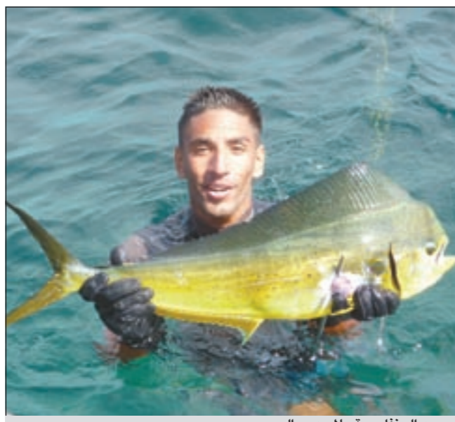
صيد العنقلوصة بالمسدس البحري