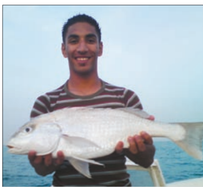
الإبتسامه حلوة والثقور أحلى