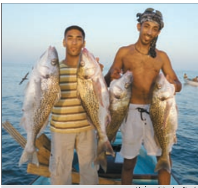
يا سلام على تقارير عُمان