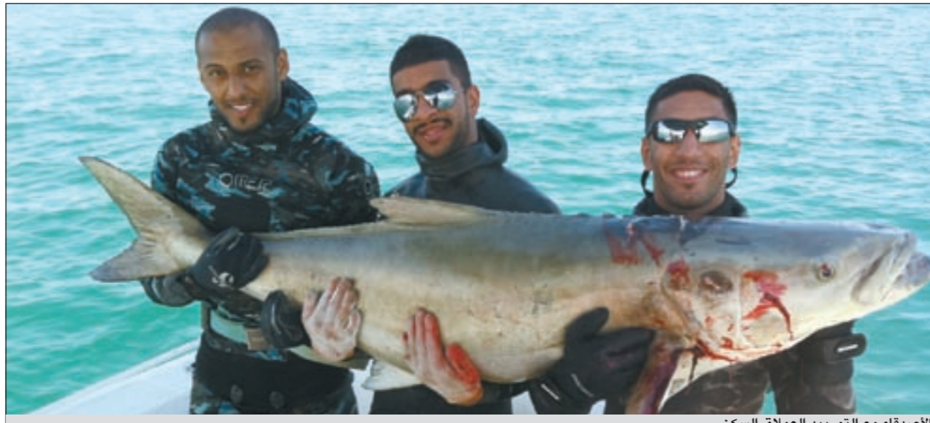
الأصدقاء مع التورييد العملاق السكن

هل تمارس الصيد بطريقة التشخيظ؟ ● نعم، ولن أتوقف عن الحداق