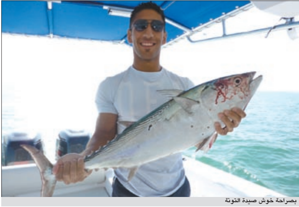
بصراحة خوش صيدة التوتة