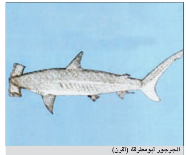
الجرجور أبومطرقة (أقرن)

نوع من أنواع أسماك القرش «الجراجر» له زوائد على جانبي رأسه توجد بها العيون يعرف علميا بـ«ابومطرقة» وعند أهل الكويت يقال له «جرجور أقرن» أي ذو قرون وهو قريب الشبه من الجرجور الولد ويصل حجمه إلى أكثر من المترين وهو نوع خطر وعدواني، لون الجلد رمادي الظاهر داكن والبطن أبيض.