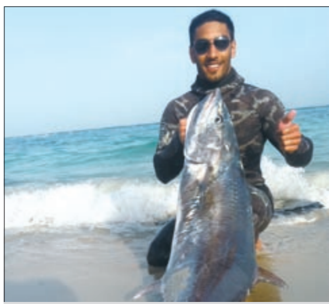
الغوص له مكاسب «جندع»