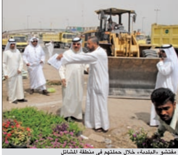
مفتشو «البلدية» خلال حملتهم في منطقة المشاتل