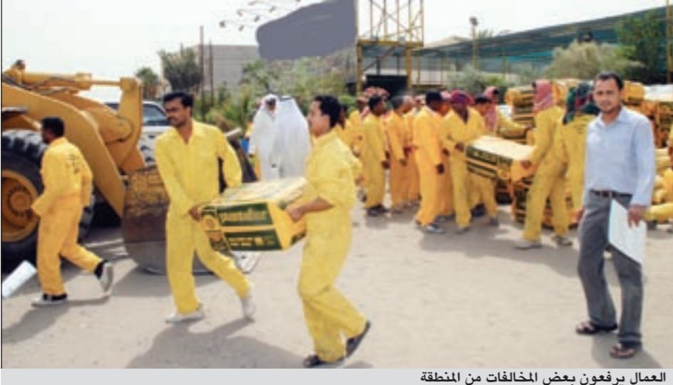
العمال يرفعون بعض المخالفات من المنطقة