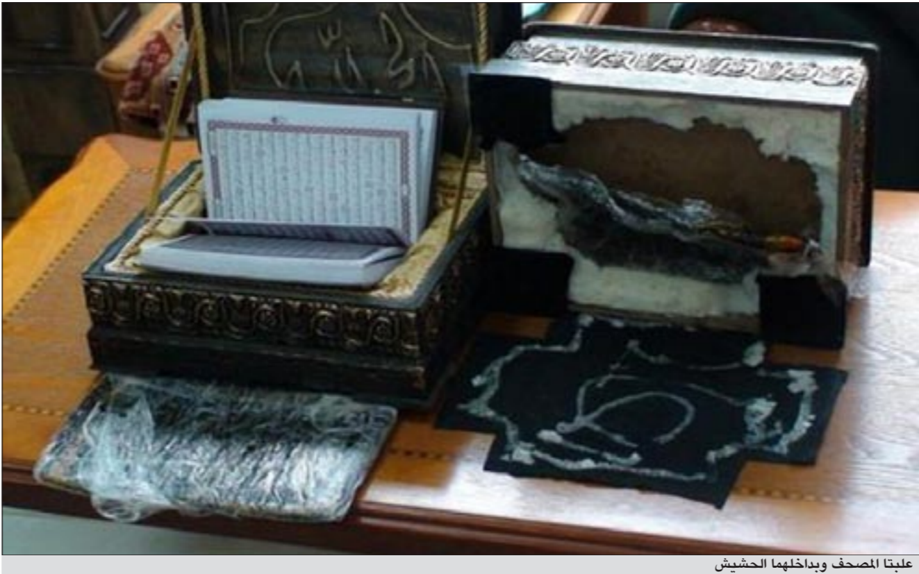
علبتا المصحف وبداخلهما الحشيش

بوليستر (فلين) ملصقة باحكام، وبإزالتها تبين وجود بلاطة من مادة الحشيش المخدر في كل علبة تحت المصحف الكريم، فيما بلغ وبعد فحصهما اتضح وجود طبقة