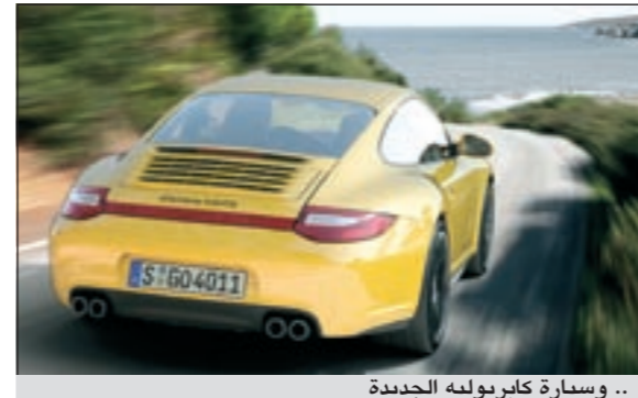
... وسيارة كابريوليه الجديدة

عزم دوران المحرك البالغ 420 نيوتن-متراً على دورات واسعة بين 4,200 و5,600 داف - يتوافر 320 نيوتن-متراً عند دورات متدنية جداً تبلغ 1,500 داف.