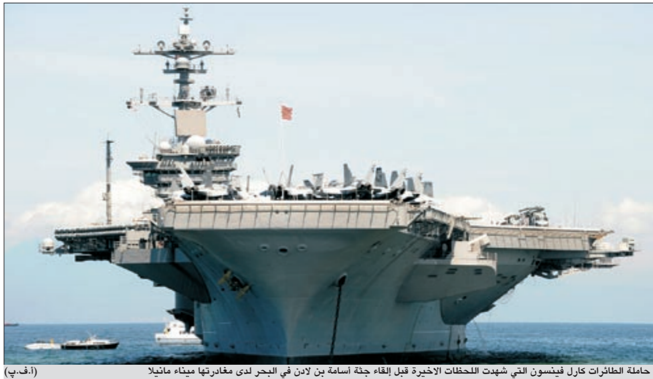
حاملة الطائرات كارل فينسون التي شهدت اللحظات الاخيرة قبل القاء أسامة بن لادن في البحر لدى مغادرتها ميناء مانيلا

بوش الابن ينفي شعوره بسعادة غامرة لمقتل زعيم القاعدة