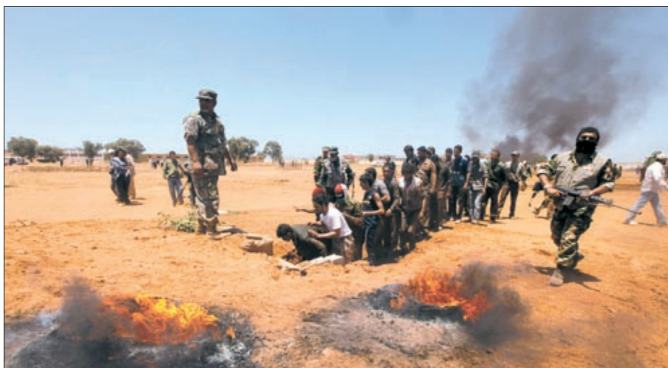
مطوعون ليبيون يتدربون للانضمام إلى الثوار في بنغازي

وكان أوكامبو قد ذكر في تصريحات سابقة أن المحققين نظروا في العديد من الوقائع التي تشهدها ليبيا، منذ اندلاع الاحتجاجات المناهضة لنظام القذافي، في 15 فبراير الماضي.