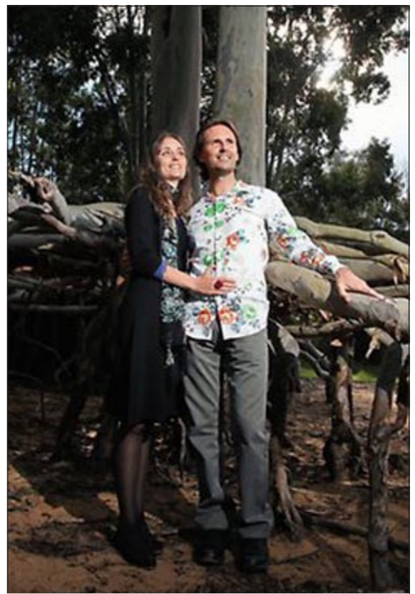
الأستراليان اللذان ادعيا انهما المسيح ومريم

سيدني - يوبي.أي: يدعي رجل وامرأة في ولاية كوينزلاند الأسترالية أنهما السيد المسيح ومريم المجدلية وجمعا ما بين 30 و40 تابعا حولهما.