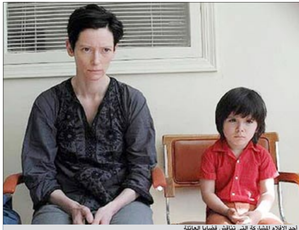
أحد الأفلام المشاركة التي تناقش قضايا العائلة

الجدل منذ يومين في كان، بسبب فيلمها «La guerre est declaree» (أعلنت الحرب)، الذي يروي قصة والدين يواجهان إصابة ابنتهما بالسرطان.