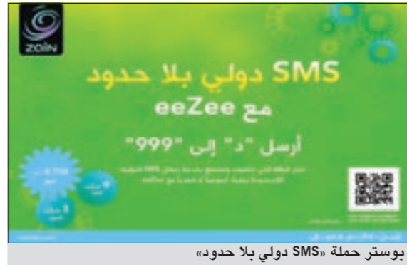
بوستر حملة «SMS دولي بلا حدود»

رسالة نصية على الرقم (999) تحتوي على حرف (د)، وحينها سيتم إرسال نصية قصيرة بلا حدود على مدار اليوم للمشارك بقيمة 750 فلساً، وعلى مدار الاسبوع للمشارك بقيمة 3 دنانير وعلى مدار شهر للمشارك بقيمة 9 دنانير. وأفادت الشركة بأنها تسعى بقوة الى إعادة أسلوب استخدام الجهاز النقال من خلال الخدمات التي تقدمها والتي تحمل معها دائماً قيمة مضافة، مشيرة الى أن هذه الحملة هي حلقة مكملة لما قامت به قبل فترة بطرحها مجموعة من العروض المميزة على خدمات الإنترنت ونقل المعلومات، لعملائها الذين يفضلون استخدام الإنترنت هواتفهم الذكية، بإطلاقها باقات الإنترنت عالي السرعة بأسعار مخفضة ودون حدود للاستخدام.