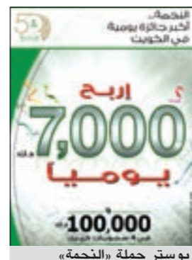
بوستر حملة «النجمة»

السحب اليومي بعد فترة أسبوع وسحوبات المناسبات بعد فترة شهرين، علماً أن حساب النجمة يمنح عملاء أكبر عدد من الفرص للربح، حيث يحصل العميل على فرصة للربح مقابل كل 25 ديناراً تبقى في الحساب بدلاً من 50 ديناراً. وسيتم منح العملاء الحاليين التي أرصدهم دون الـ 500 دينار مهلة لغاية 27 يونيو لزيادة الرصيد وحتى هذا التاريخ سيتم دخولهم في جميع السحوبات.