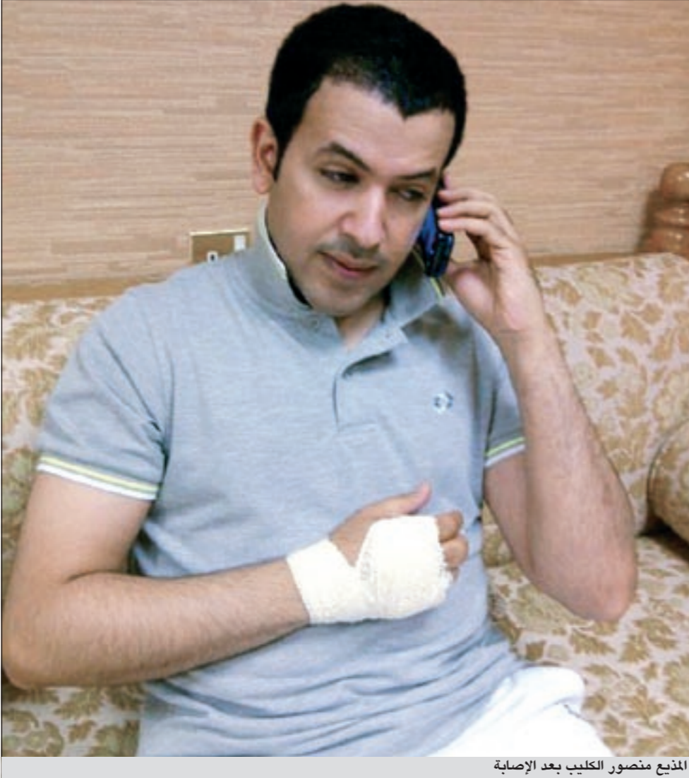
المذيع منصور الكليب بعد الإصابة

● لا حتى ما شاف الجرح كل اللي قاله روحوا للمضمد شكله الفيلم شاده حيل واحنا خربنا عليه!