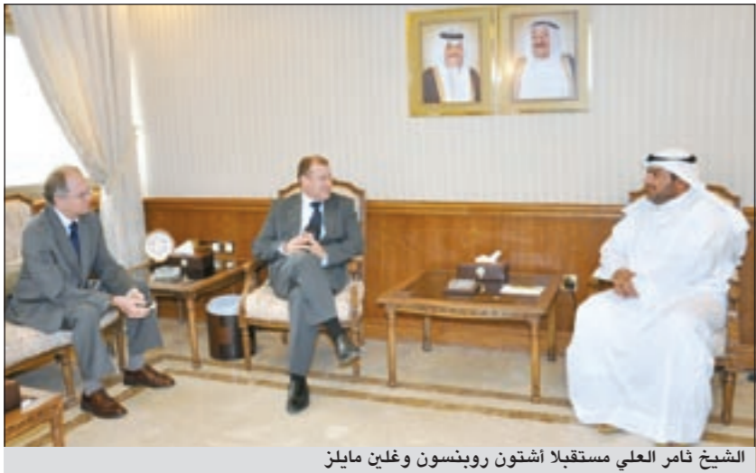
الشيخ فامر العلي مستقبلا اشتون روبنسون وغلين مايلز

الغنائية بين البلدين الصديقين اضافة الى آخر التطورات والمستجدات على الساحتين الإقليمية والدولية والقضايا ذات الاهتمام المشترك. حضر المقابلة السفير الاسترالي لدى الكويت غلين مايلز.