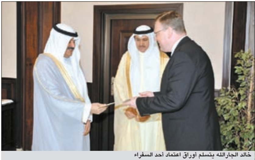
خالد الجارالله يتسلم أوراق اعتماد أحد السفراء

اليكساندر سيميشكو وسفير نيوزيلندا رود هاريس وسفير جمهورية استونيا اندريه بونغ، وذلك بحضور كل من مدير ادارة المراسم ضاري العجران ومدير ادارة مكتب الوكيل بالانابة ايهم العمر.