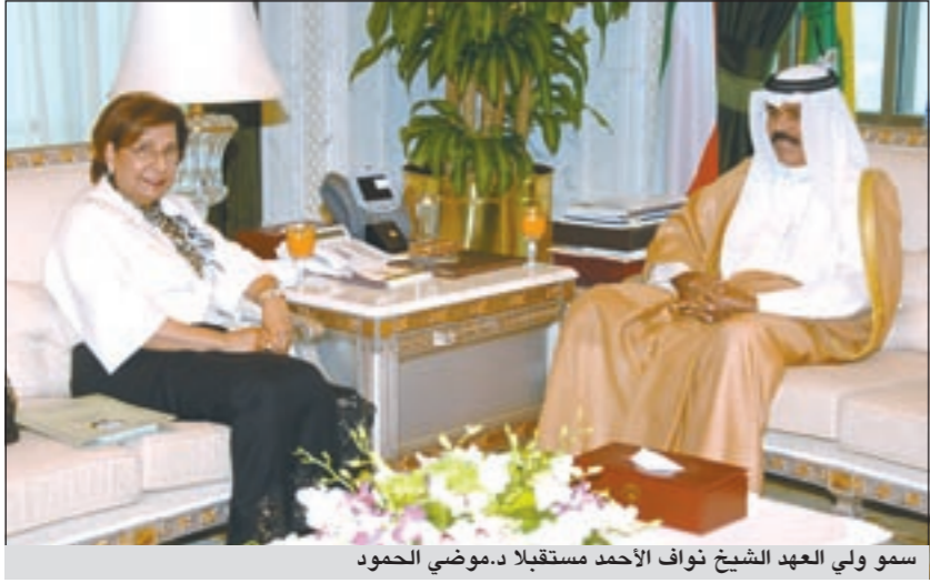
سمو ولي العهد الشيخ نواف الاحمد مستقبلا د.موضي الحمود

الاسكان ووزير الدولة لشؤون التنمية الشيخ احمد الفهد ووزير الدولة لشؤون مجلس الوزراء علي الراشد ووزير الاوقاف والشؤون الاسلامية محمد النومس.