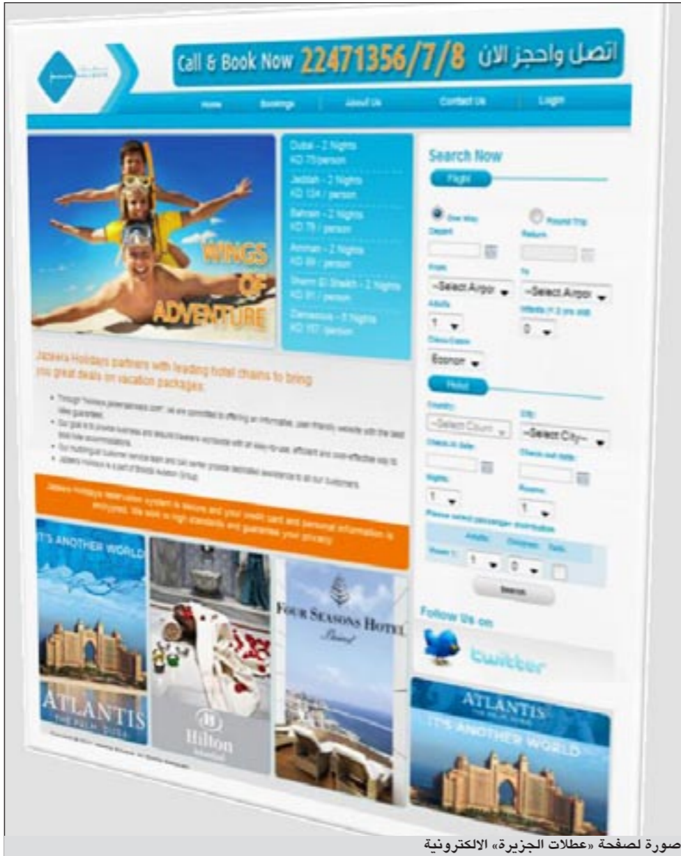
صورة لصفحة «عطلات الجزيرة» الإلكترونية

يذكر أن «طيران الجزيرة» حائزة على جائزة «أفضل شركة طيران» لعام 2010 قدمتها «مجلة أرابيان بيزنس»، بالإضافة إلى الجائزة الذهبية من قبل «ماجناوم أوبس أوردر 2010»، وتتشغل الشركة رحلات إلى 18 وجهة في الشرق الأوسط وشمال أفريقيا خلال موسم الصيف 2011.