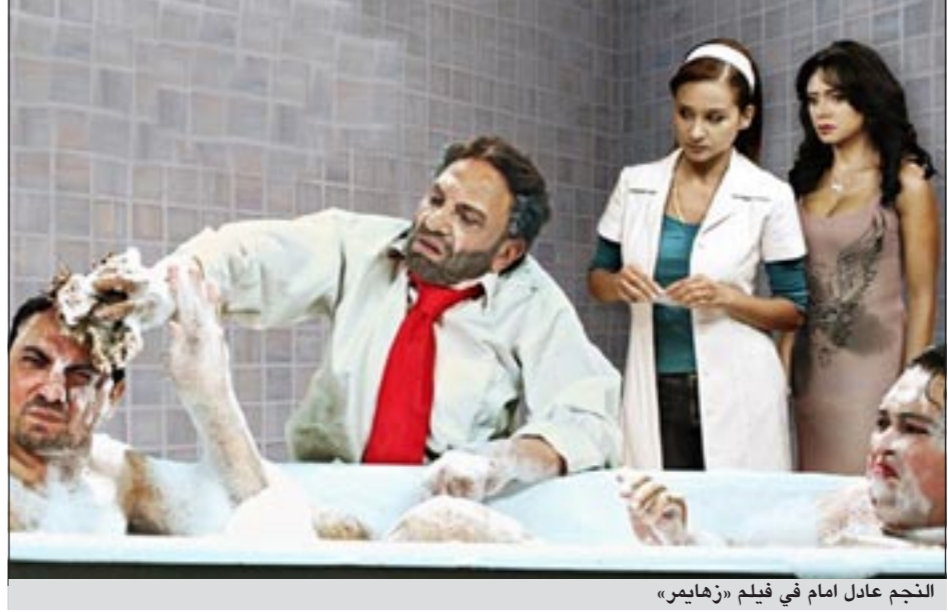
النجم عادل إمام في فيلم «زهaimer»

فيلمه «زهaimer» الذي جعل من يشاهد هذا الفيلم يضحك و«يستهنئ» على المصاب بداء «الزهايمر» بينما الكاتبة القديرة عواطف البدر استطاعت أن تبكي المشاهدين وهم يشاهدون بطل