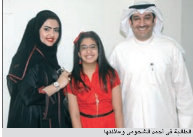
الطالبة في أحمد الشحومي وعائلتها