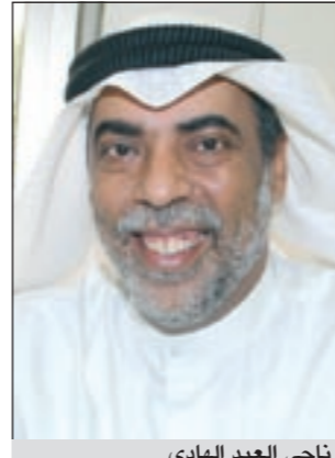
ناجي العبد الهادي

شدد النائب ناجي العبد الهادي على ضرورة احترام الكفاءات المهنية الكويتية، وعدم تهميش الكفاءات الوطنية في كافة القطاعات، مستنكرا التجريح الكبير الذي يتعرض له مدير عام هيئة البيئة د.صلاح المضحي، بعد ان ألغت محكمة الاستئناف قرار تعيين المضحي مديرا عاما للهيئة العامة للبيئة بدرجة وكيل وزارة، مؤكدا اعتزازه بالقضاء الكويتي فهو الملاذ الامن والاخير للجمع. واشار العبد الهادي الى ان واقع الحال يقول ان المضحي انجز ولم يحاب احدا، ولعل هذا هو السبب في الهجوم عليه، لا لشيء الا لانه طبق القوانين وطلب مزيدا من التشريعات التي تحتاجها البيئة للحفاظ عليها وعدم استنزافها. وبشأن التشكيك في اختصاصه قال العبدالهادي: المضحي استاذ في كلية الهندسة والبترون ومختص في الجيولوجيا والبترون، وهو من المهنيين والقادرين على اتخاذ القرار الفتي في مواقع الحفاظ على بيئة وثروات هذا الوطن.