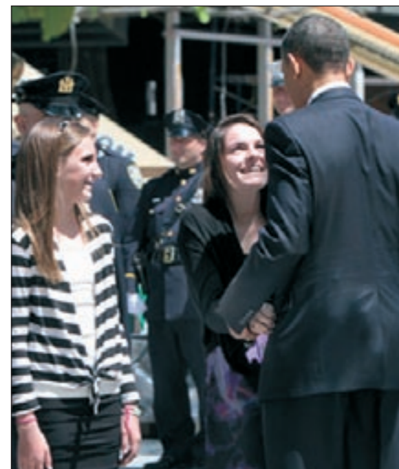
أوباما مع الأميركية المراهقة ابنة أحد ضحايا 11 سبتمبر

غير أن بعض وسائل الإعلام شككت في قدرة الرئيس على تأمين لقاء الفتاة بنجمها المفضل، ونقل الموقع عن مصادر مقربة من بيبير إنه سعد جدا لتلقي الاتصال من البيت الأبيض وأنه سيلتقي الفتاة حين يعود إلى الولايات المتحدة، ولم يحدد موعد اللقاء حتى الآن.