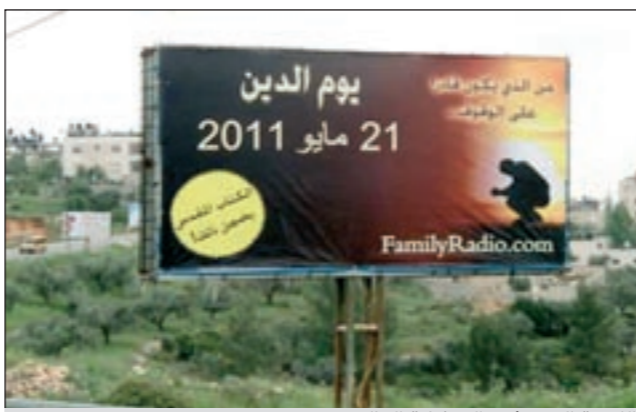
اللوحه التي تشير إلى نهاية العالم

على مدخل مدينة نابلس شمال الضفة الغربية بالقرب من حاجز حوارة». وأضاف الجاغوب: سالت