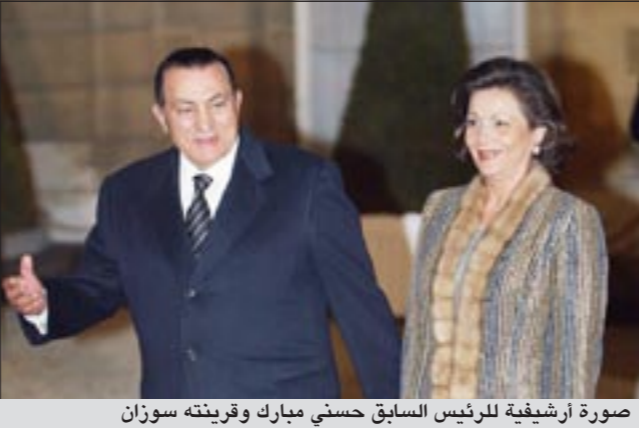
صورة أرشيفية للرئيس السابق حسني مبارك وقرينته سوزان

عواصم - وكالات: بعد ساعات من قرار حبسها الاحتياطي بتهمة الثراء غير المشروع نقلت سوزان مبارك نائب صالح قريبة الرئيس المصري السابق حسني مبارك أمس الى مستشفى بشرم الشيخ وذلك «بعد الاشتباه بإصابتها بأزمة قلبية»، بحسب ما افاد مسؤول في المستشفى. وكان جهاز الكسب غير المشروع في مصر قرر حبس سوزان مبارك لمدة 15 يوما على ذمة التحقيقات لاتهامها بتحقيق ثراء غير مشروع، وذلك عقب استجواب الجهاز لها والذي تردد انه تم بمستشفى شرم الشيخ الدولي وبغرفة مجاورة للغرفة التي يرقد بها مبارك ولم يحدد موعدا لترحيلها الى سجن النساء بالقنطرة. وكان الجهاز قد قرر في وقت سابق أمس الاول حبس مبارك 15 يوما على ذمة التحقيقات. وترددت انباء انه قامت ادارة مستشفى شرم الشيخ الدولي أمس الاول بعمل التحقيقات اللازمة داخل الغرفة التي يرقد فيها الرئيس السابق محمد حسني مبارك وذلك حتى يقوم اعضاء لجنة الفحص والتحقيق بجهاز