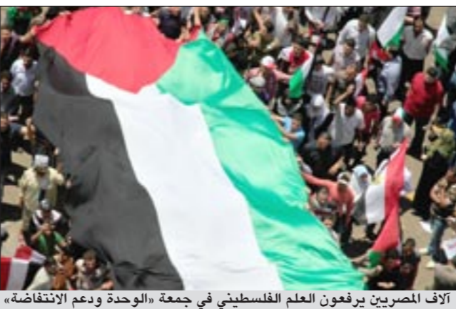
آلاف المصريين يرفعون العلم الفلسطيني في جمعة «الوحدة ودعم الانتفاضة»

المرورية وعدم حدوث حالات احتقان في تسيير السيارات بالإضافة الى إخلاء الحديقة الرئيسية المتواجدة داخل منطقة الميدان. يذكر أن المظاهرات تشرف على تنظيمها اللجنة التنسيقية لجماهير الثورة وتضم ائتلاف شباب الثورة وجماعة الإخوان المسلمين والجمعية الوطنية للتغيير ومجلس أمناء الثورة وتحالف ثوار مصر وائتلاف مصر الحرة وجماعة الأكاديميين المستقلين وبعض الشخصيات الوطنية من المستقلين. وكان آلاف المصلين أدوا صلاة الفجر العاص بمساجد النور وعمرو بن العاص وميدان التحرير والمحافظات المصرية والمقبة بـ «مليونية صلاة الفجر» والتي دعا اليها آلاف من المسلمين على موقع التواصل الاجتماعي على شبكة الانترنت «فيس بوك» من خلال تنظيم صلوات فجر مليونية في أيام الجمعة والسبت والأحد من أجل نصره الشعب الفلسطيني تحت شعار «الشعب يريد العودة الى فلسطين».