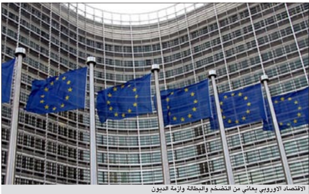
الاقتصاد الأوروبي يعاني من التضخم والبطالة وأزمة الديون

متزايد، بشأن الاقتصاد، مشيرة إلى ارتفاع معدل التضخم الذي بلغ 2,6% في منطقة اليورو و3,3% في الاتحاد الأوروبي هذا العام، و«هشاشة» أسواق المال وخصوصاً في قطاع السندات السيادية. كما من المقرر أن تظل عملية التعافي «بلا جدوى وظيفياً» مع توقعات ببلوغ معدل البطالة في منطقة اليورو 10% هذا العام على أن ينخفض إلى 9,7% في العام القادم، بينما سيخفّض المعدل في الاتحاد الأوروبي من 9,5% إلى 9,1% خلال الفترة ذاتها. وصدرت البيانات حيث تزايدت التكهات بشأن إمكانية إعادة هيكلة ديون اليونان مع قول الكثير من خبراء الاقتصاد إن حزمة الإنقاذ البالغة 110 مليارات يورو (157,5 مليار دولار) وحصلت عليها البلاد العام الماضي ليست كافية. وما يعزّز حجم التحديات التي تواجهها السلطات في أيضاً، قال تقرير المفوضية إن الدين اليوناني من المتوقع أن يرتفع إلى رقم مرتفع جداً يبلغ 166,1% من الناتج المحلي الإجمالي في عام 2012، مرتفعاً من 142,8% في عام 2010. كما اضطرت الذراع التنفيذية للاتحاد الأوروبي إلى تعديل كبير لتوقعات النمو للبرتغال ثالث دولة بمنطقة اليورو سيحصل على حزمة إنقاذ تبلغ قيمتها 85 مليار يورو والمتوقع الموافقة عليها الأسبوع المقبل. وفي آخر توقعاتها الاقتصادية الشاملة في نوفمبر، توقعت بروكسل أن تخرج البلاد من الركود في عام 2012 بمعدل نمو يبلغ 0,8%، لكنها الآن تقول إن الاقتصاد سينكمش بنسبة 1,8% في ذلك العام.