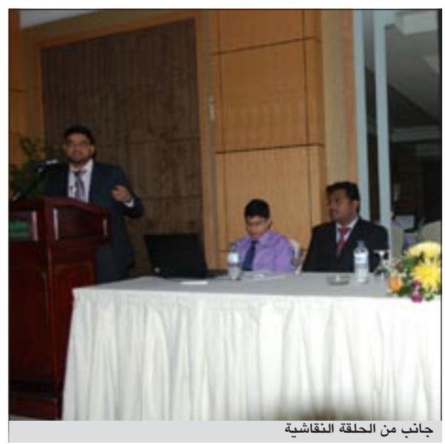
جانب من الحلقة النقاشية

وإدارة مقدم الخدمة وادارة الدليل النشط واعداد تقارير عن المبادلة وغير ذلك. وتعتبر برهان تيك هي موزع الادارة الرسمية في الكويت، كما تركز على الحدث ذي الفاعلية في