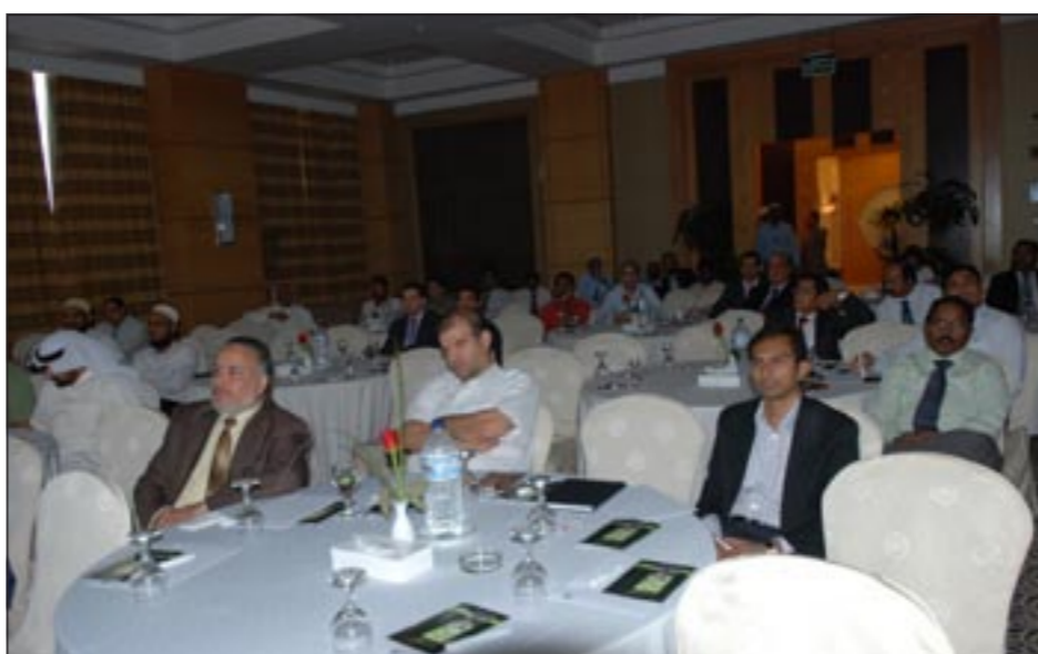
جانب من الحضور (كرم ذياب)

أكثر من 50 مؤسسة صغيرة وكبيرة والمئات أكثر في الشرق الأوسط وفي الكثير من العالم، حضر الحدث العديد من الشركات المعروفة والهيئات الحكومية. ندى أبو النصر