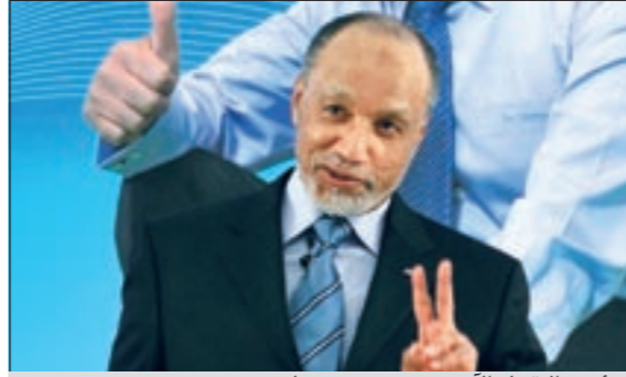
رئيس الاتحاد الآسيوي محمد بن همام

20 مليون يورو من أموال الـ «فيفا» لفريق العمل لمكافحة الفساد بالتعاون مع المنظمة الدولية للشرطة الجنائية «الانتربول». وكتب بن همام على مدونته الشخصية: «أصبح واضحا مرة أخرى في الأيام الماضية ان هناك حاجة ماسة لتحسين صورة الـ «فيفا». لقد تم جزّ إطار جولة للدعاية ومنظمتها الرائدة إلى الوحد مرة جديدة». وتابع بن همام انه تحت رئاسة بلاتر: «من