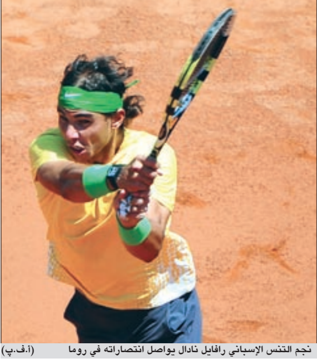
نجم التنس الإسباني رافاييل نادال يواصل انتصاراته في روما (أ.ف.ب)

بلغ الإسباني رافاييل نادال المصنف الأول وحامل اللقب الدور ربع النهائي من دورة روما الدولية للتنس، خامس دورات الألف نقطة للماسترز والبالغ جوائزها المالية 2,750 مليون يورو للرجال و2,050 مليون يورو للسيدات، بفوزه على مواطنه فيليسيانو لوبيز بسهولة 6-4 و6-2.