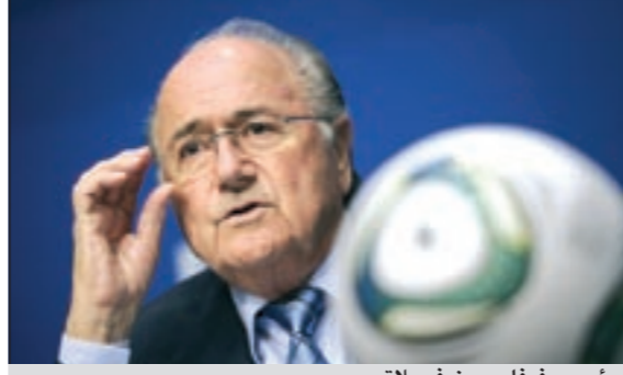
رئيس «فيفا» جوزيف بلاتر

وتابع بن همام: «كيف يمكننا اقناع الناس ببراءة الـ «فيفا»؟ يجب ان ننزل بيئة جديدة على الاتحاد الدولي». وكان بن همام رفض بقوة اتهامات الرشوة الموجهة ضد سلاله من اجل الحصول على تنظيم مونديال 2022، بعد ان اتهم نائب في البرلمان البريطاني عضوين في اللجنة التنفيذية للاتحاد الدولي بحصولهما على مبلغ مقداره 1,5 مليون دولار لمنح صوتهما ملف قطر الذي فاز بشرف تنظيم كأس العالم عام 2022. بيد ان بن همام نفى نفيا قاطعا اي محاولات رشوة من قبل بلاده وطلب بتقديم الانتبسات بهذا الصدد. وكان بن همام قد وصل إلى القاهرة الخميس الماضي قادما على متن طائرة خاصة من تونس في زيارة لمصر تستغرق عدة أيام. وتأتي زيارة بن همام إلى مصر في إطار جولة للدعاية واختياره رئيسا لـ «فيفا» خلال الانتخابات المقررة في يونيو المقبل.