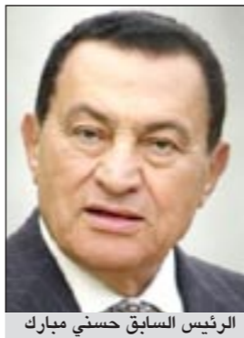
الرئيس السابق حسني مبارك

القاهرة: كشفت تقارير صحفية أمس عما جرى أثناء تحقيق النيابة العامة مع الرئيس السابق حسني مبارك في مستشفى شرم الشيخ الدولي حول الاتهامات الموجهة إليه في عدد من القضايا منها الفساد وتسهيل الاستيلاء على المال العام بالإضافة لتورطه في قضية قتل المظاهرات. وذكرت صحيفة «الأخبار» المصرية في عددها أمس ان تحقيقات النيابة العامة الثلاثة مع الرئيس السابق استمرت لمدة ساعتين متواصلتين داخل غرفته بمستشفى شرم الشيخ. ونفى مصدر قضائي كبير ما تردد حول تعرض مبارك لإرهاق شديد وفقدته للوعي والنطق خلال التحقيقات، مؤكداً انه أثناء التحقيق طلب الرئيس السابق قياس