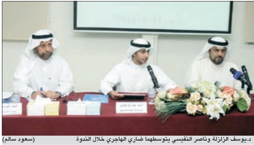
ديوسف الزلزلة وناصر النفيسي يتوسطهما ضاري الهاجري خلال الندوة (سعود سالم)

أكد رئيس اللجنة المالية والاقتصادية في مجلس الأمة النائب د.ديوسف الزلزلة أن الكويت تفتقد رؤية تنموية حقيقية لمستقبل اقتصادها، واصفاً ميزانية الكويت بالمسح مقارنة بميزانيات دول أخرى مجاورة.