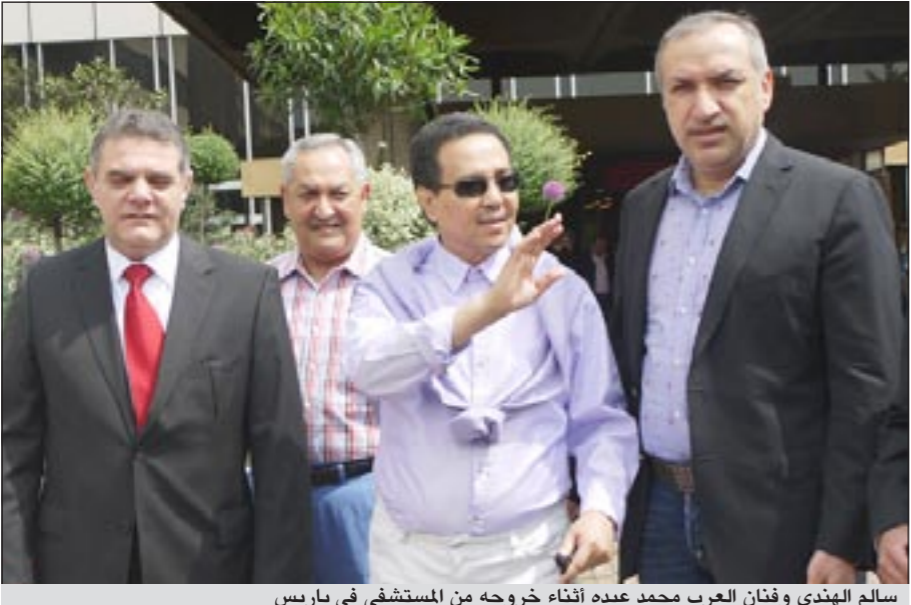
سالم الهندي وفنان العرب محمد عبده أثناء خروجه من المستشفى في باريس

له، كذلك إلى أصحاب السمو والمعالى الوزراء والسفراء وأصحاب السعادة في المملكة العربية السعودية وجمع دول الخليج من شيوخ وأمرء وإلى كل من سال عنه من جميع محبيه. مؤكداً في الوقت نفسه أن كل هذه الاتصالات قد ساهمت وبشكل كبير في تحسين حالته الصحية وأسرعته في التحاوب للعلاج، مشيراً إلى أن فنان العرب بعد مغادرته للمستشفى سيبقى في باريس لفترة نقاهة تصل قرابة الشهر ومن ثم سيعود إلى أرض الوطن بإذن الله. كذلك أشار سالم الهندي عند الحديث مع فنان العرب إلى عدم رضاه وانزعاجه بالإشاعات الكاذبة وغير الدقيقة حول حالته الصحية والتي تتناقلها الأوساط المختلفة. مشيراً إلى أن هذه الإشاعات قد أضرت كثيراً وبشكل خاص الفنان محمد عبده، لاسيما عائلته أيضاً التي أزعجها كثيراً تلك الأنباء، معتبراً هذه الإشاعات تنعكس على أي شخص مريض أو في أزمة صحية. مؤكداً على مقولة «العلاج نصفه نفسي» حسب مقولة الأطباء.