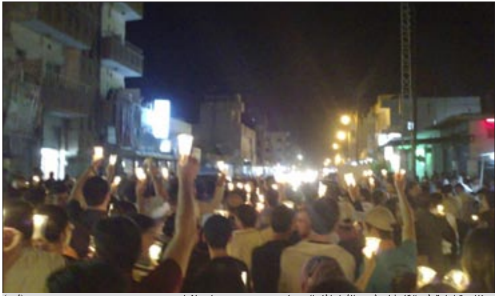
مظاهرة ليلية في القامشلي أمس الأول لفض الحصار عن حمص ودرعا وبانياس