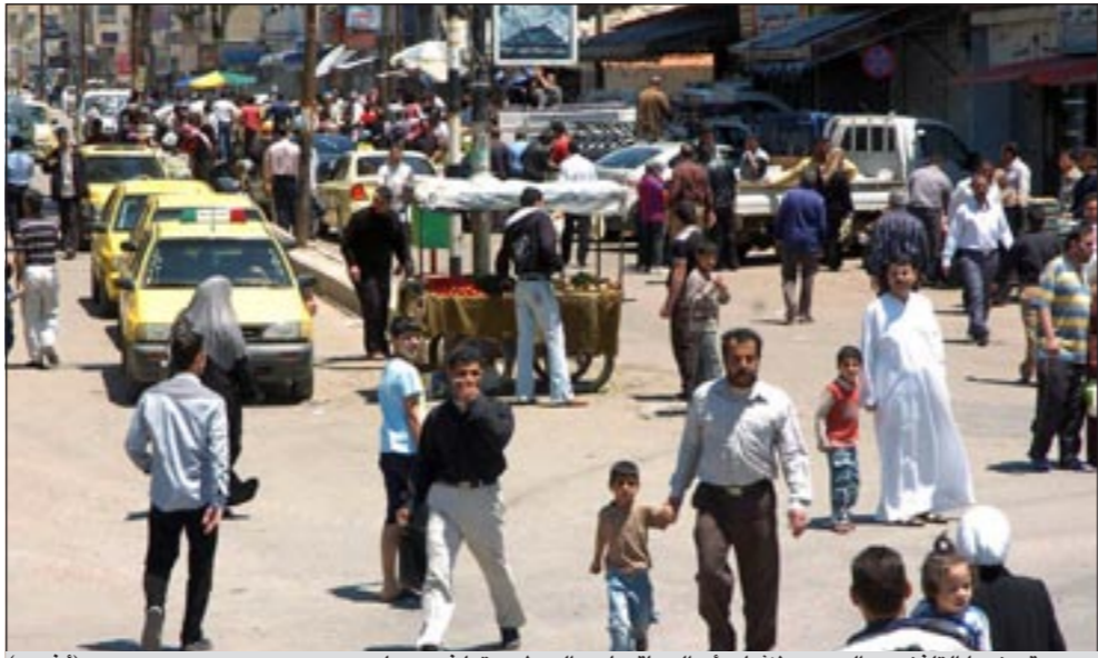
صورة وزعمها التلفزيون السوري لانبثاق الحياة عادت إلى طبيعتها في درعا