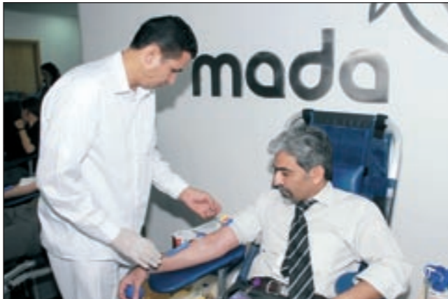
موظف يتبرع بدمه