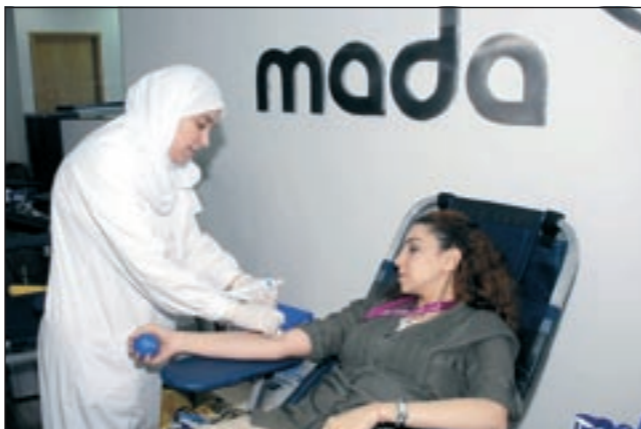
.. وموظفة تتبرع بالدم

في سياق استراتيجيتها الرامية إلى ممارسة دور فاعل على صعيد مشاعر المواطنة والمسؤولية الاجتماعية، وانطلاقا من الأهمية الإنسانية البالغة لنشاط التبرع بالدم للفرد والمجتمع، وتماشيا مع أيمانها العميق بوجوب المساهمة بجهود الرعاية الصحية المبدولة لصالح المواطنين، نظمت شركة مدي للاتصالات للسنة الثانية على التوالي حملة ميدانية للتبرع بالدم شملت جموع كادرها الوظيفي البالغ عددهم قرابة 100 فرد في فروع الشركة مؤخرا. وقد سبق الحملة الميدانية للتبرع بالدم حملة توعوية سلطت بها «مدي» الضوء على أهمية نشاط التبرع بالدم والفائدة المرجوة منه سواء للمتبرع أو المتبرع له في آن واحد، وتجدر الإشارة إلى أن مدي للاتصالات، إحدى شركات الاتصالات المرموقة في الكويت والمنطقة المعنية بتقديم خدمات الاتصالات والإنترنت، وهي اليوم تحتل مكانة ريادية في طليعة مقدمي خدمات التكنولوجيا اللاسلكية لمؤسسات القطاع الحكومي والنقطة وشركات القطاع المالي وللمعملاء الأفراد.