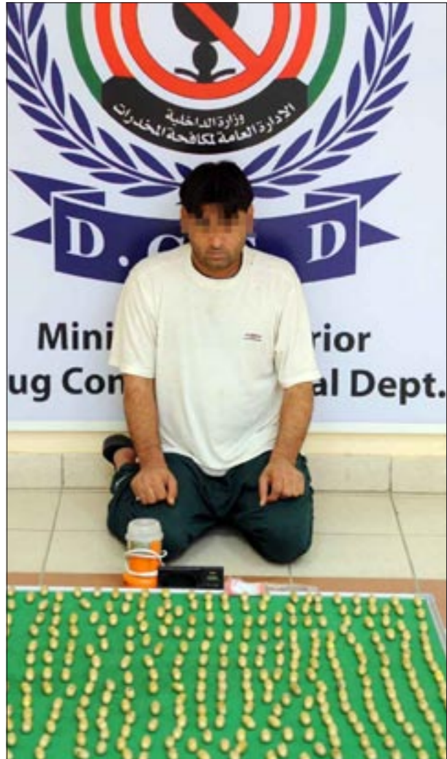
المتهم وامامهم كمية الهيروين المضبوطة

ومضى المصدر الامني بالقول ما ان كلف مدير ادارة العمليات العقيد محمد الهزيم بالقضية