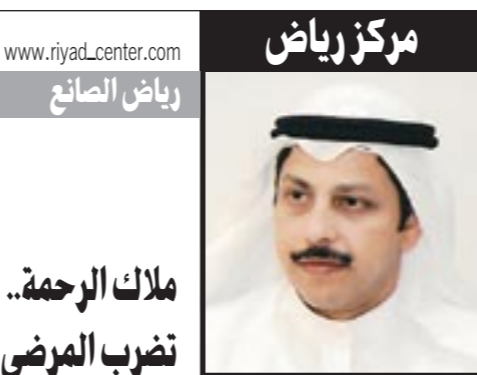
www.riyadcenter.com رياض الصانع