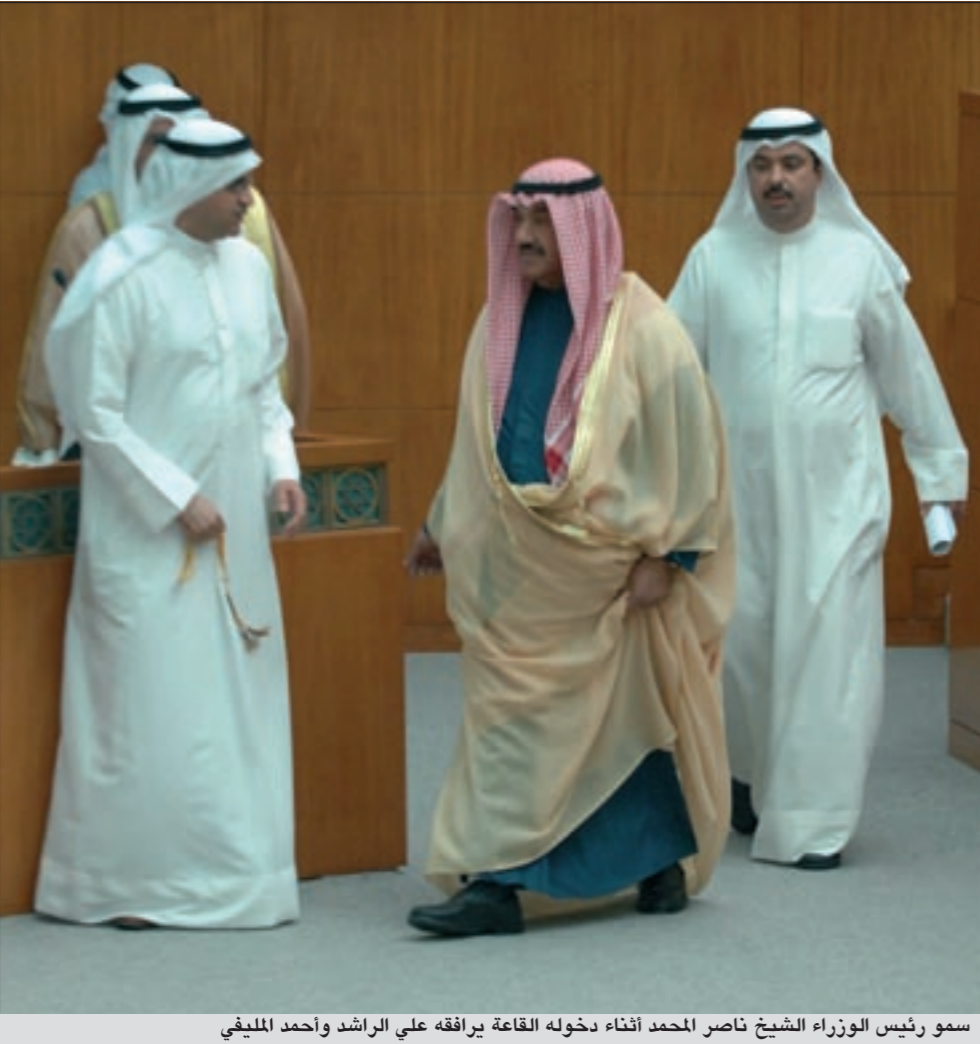
سمو رئيس الوزراء الشيخ ناصر المحمد أثناء دخوله القاعة يرافقه علي الراشد وأحمد المليفي