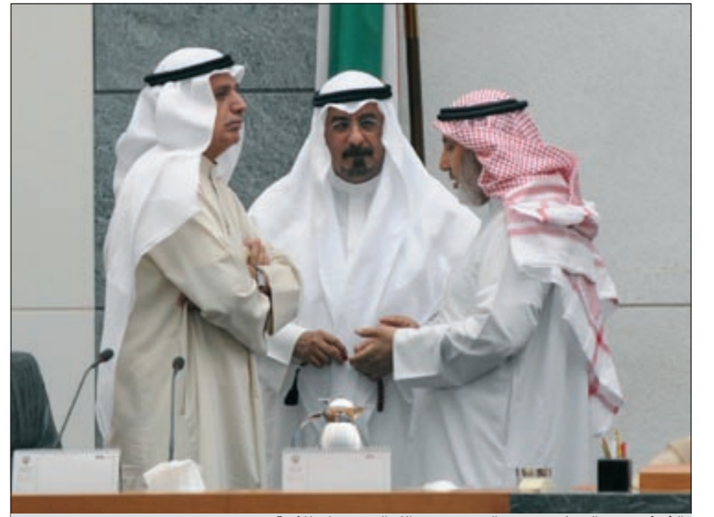
الشيخ د.محمد الصباح ود.محمد البصري وعبدالله الرومي على المنصة

ومتدنية، وعلى الوزير القيام بدوره كما ينبغي لرفع الخدمات الصحية.