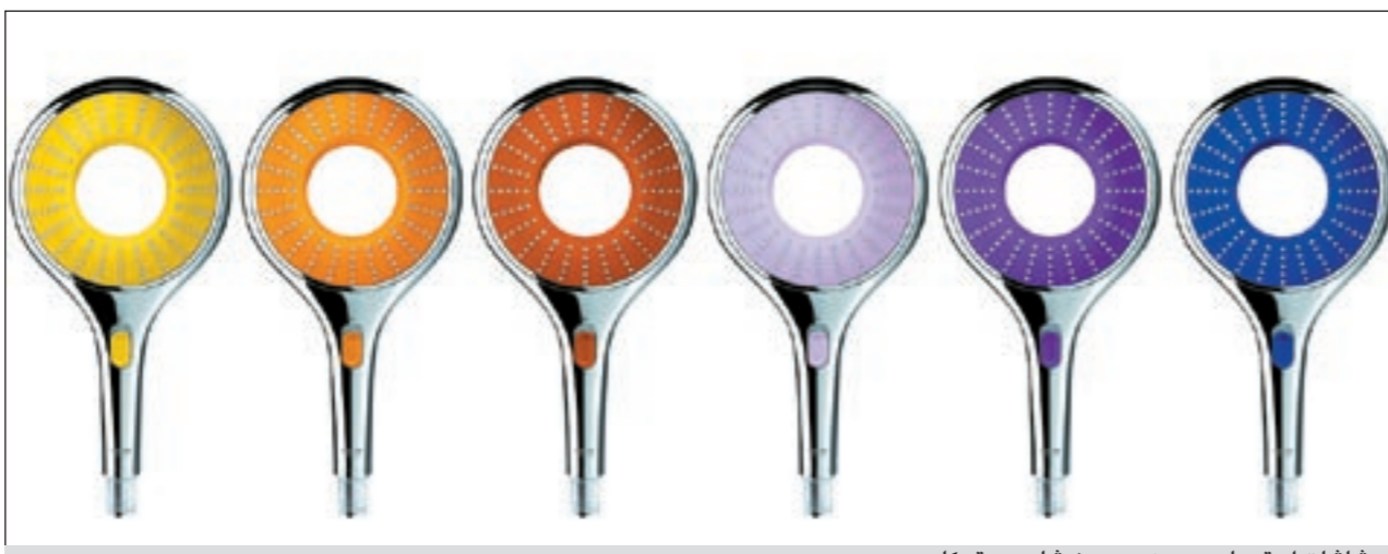
رشاشات استحمام «جروهي» «رين شاوور ووتر كلر»

منطقة شرق البحر الأبيض المتوسط والشرق الأوسط، وأفريقيا، صندوق بريد 1641، نيقوسيا، قبرص.