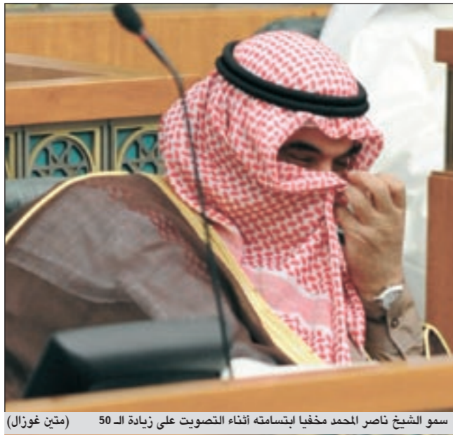
سمو الشيخ ناصر المحمد مخفياً لاجتماعه أثناء التصويت على زيادة الـ 50 (متين غوزال)

واعتبر المليفي مهنة التعليم من المهن المشاقة. وقال الوزير المليفي: أن مهنة التعليم تتطلب من المعلم عسكرة فكره بعد اطلاع واسع وتحضير مسبق، مضيفاً وتطلب أيضاً مجهوداً بدنياً فهو يظل واقفاً طوال الحصص الدراسية المطلوبة منه. • التفاصيل ص 5-9