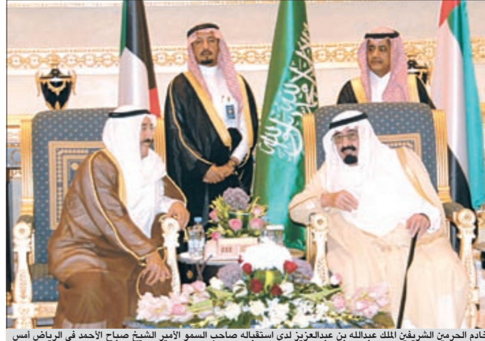
خادم الحرمين الشريفين الملك عبدالله بن عبدالعزيز لدى استقباله صاحب السمو الأمير الشيخ صباح الأحمد في الرياض أمس

في قمتهم الخليجية التشاورية الـ 13 رجب قادة ورؤساء وفود دول التعاون في الرياض بطلب الأردن للانضمام إلى المجلس كما دعوا المغرب للانضمام، كما بحثوا أحداث البحرين وسلطنة عمان إضافة إلى المبادرة الخليجية لحل الأزمة اليمنية. كما كان ملف العلاقات مع إيران وتدخلاتها الأخيرة في شؤون دول التعاون وتصريحات بعض المسؤولين فيها على طاولة البحث إلى جانب ملف الجزر الإماراتية الثلاث (طنب الكبرى وطنب الصغرى وأبو موسى) التي تحتلها إيران وعدد من الموضوعات ذات الصلة بالعمل الخليجي المشترك في جميع المجالات فضلاً عن مجمل المستجدات الإقليمية والدولية. وكان الأمين العام للمجلس د.عبد اللطيف الزياتي قد أكد أن اللقاء التشاوري يتيح للقيادة استعراض ومتابعة مسيرة العمل الخليجي المشترك بجميع جوانبها، وكذلك المستجدات العربية والإقليمية والدولية ذات الاهتمام المشترك. • التفاصيل ص 3