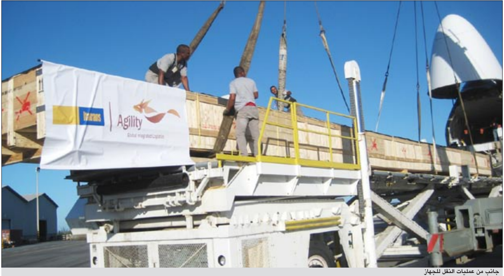
جانب من عمليات النقل للجهاز