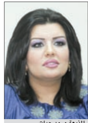
المذبة ورود حيات

تطلق الفنانة نجوى كرم قريباً قناة «نجوى كرم» التلفزيونية الإلكترونية عبر «اليوتيوب» التي ستغطي نشاطاتها الفنية وإطلاقاتها التلفزيونية واعمالها. هذا إضافة إلى لقاءات خاصة وصحفية مع شخصيات إعلامية وفنية واجتماعية تتحدث مباشرة عن نجوى كرم ومن خلال الكاميرا الخاصة بثلاثتها. وتبدأ القناة أول تحقيقاتها الأسبوع المقبل حول آراء الرأي العام في شمس الغنمية نجوى كرم ومن خلال ميكروفون جهز