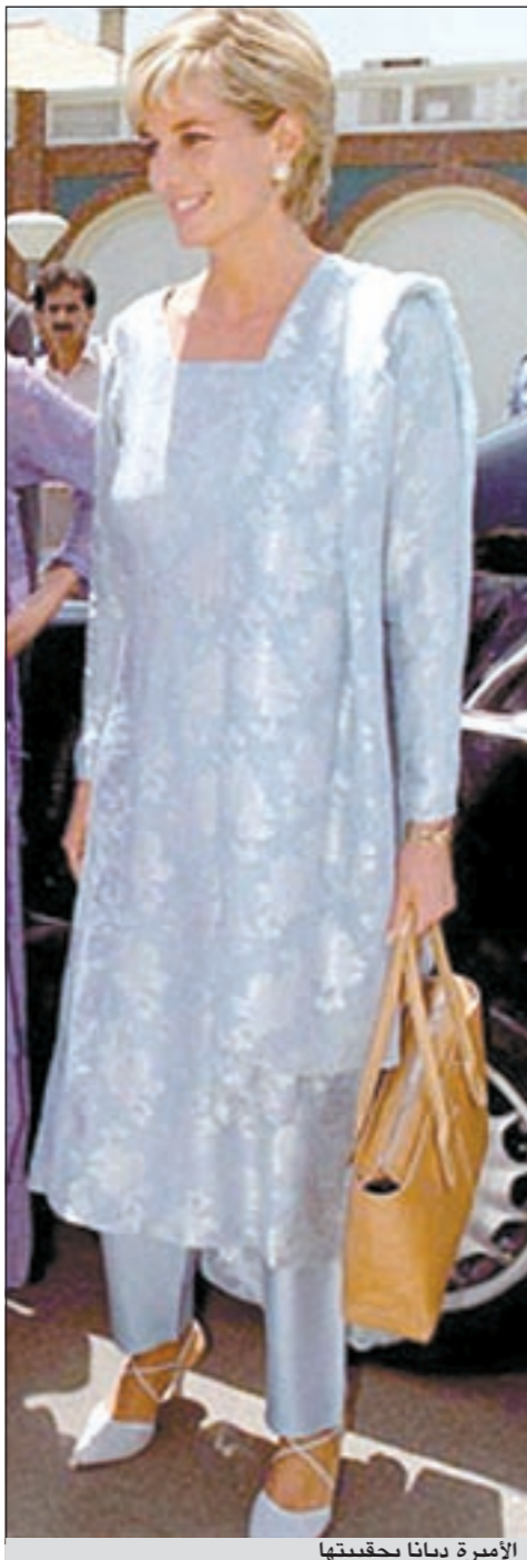
الأميرة ديانا بحقيبتها

بعد وفاة ديانا عام 1997 لأنها كانت من محبات هذه الدار. وأعجبت ديانا بالحقيبة أثناء جولة تسوق في أحد متاجر الدار وانتقتها بنفسها وذلك على خلاف ما هو سائد حالياً، إذ تتسابق دور الموضة العالمية إلى تقديم أحدث ابتكاراتها إلى الأميرات والشهيرات وهن جالسات في منازلهن، وذلك لتحظى تلك الابتكارات بتغطية إعلامية.