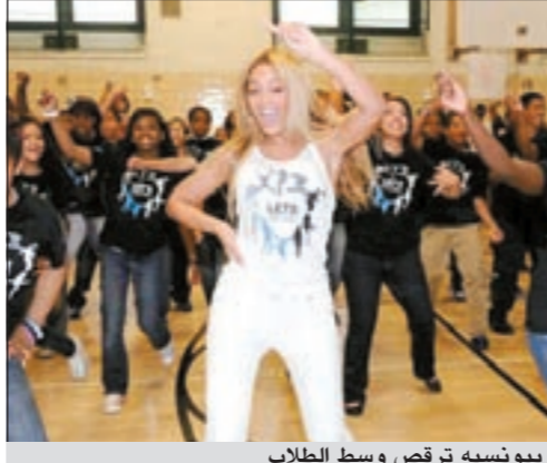
بيونسيه ترقص وسط الطلاب

نيويورك- وكالات: قامت المغنية الأميركية بيونسيه بمفاجأة طلبة إحدى مدارس منطقة «هارلم» في ولاية نيويورك، حيث ظهرت في مقر المدرسة ورقصت للطلاب على أغنياتها Move Your Body. وقامت بيونسيه بذلك ضمن حملة السيدة الأولى في أميركا ميشيل أوباما Let's Move، والتي تهدف إلى محاربة سمنة الأطفال وزيادة وزنهم. هذا وانتهت بيونسيه من تسجيل أغنية «Move Your Body» والتي قامت بتصويرها على طريقة الفيديو كليب وهي ترقص فيه بخطوات رياضية راقصة بسيطة، لتحفز الصغار على القيام بها. وتم نشر هذا الكليب في أغلب المدارس الأميركية الثانوية والإعدادية تفعيلاً لحملة ميشيل أوباما.