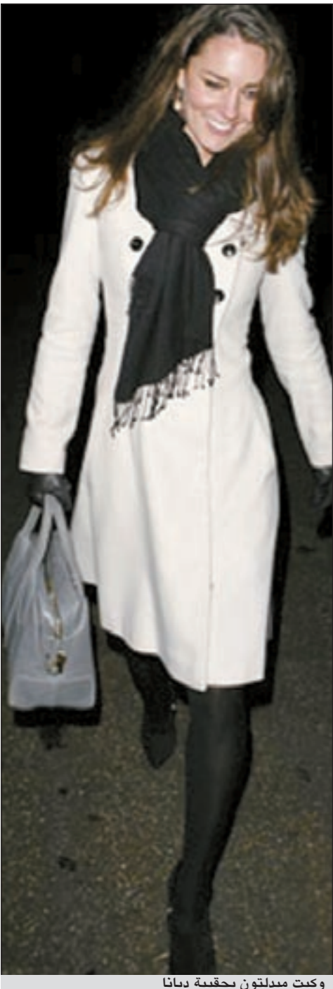
وكيت ميدلتون بحقيبة ديانا