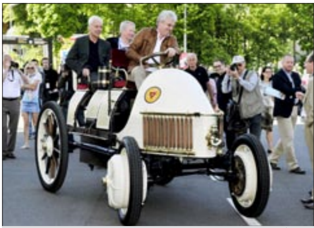
الاحتفال بمرور 125 عاما على تصنيع هذه السيارة

شتوتغارت - د.ب.أ: انطلقت أمس في شوارع ألمانيا سيارات كورسو التاريخية احتفالا بمرور 125 عاما على بداية تصنيع هذه السيارة داخل البلاد.