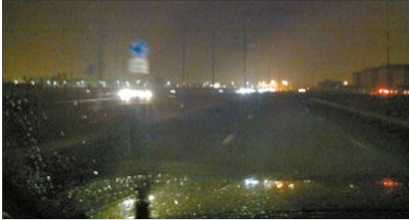
سوء الأحوال الجوية والأمطار يزيد من خطر وقوع الحوادث أثناء الظلام