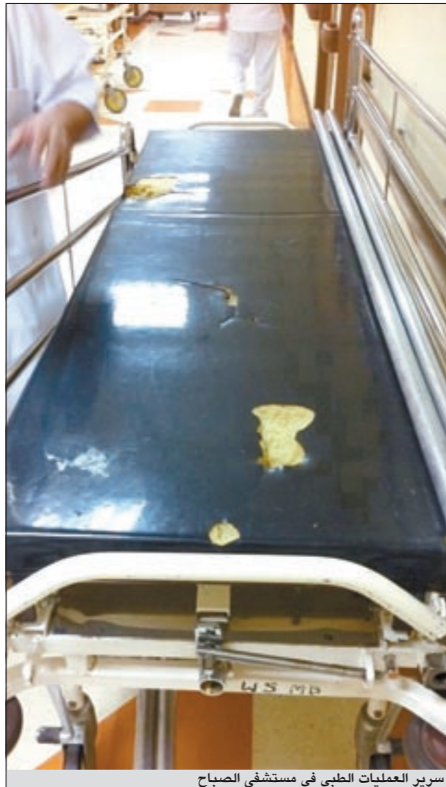
سرير العمليات الطبي في مستشفى الصباح