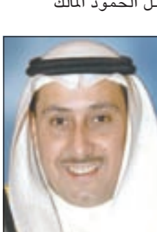
الشيخ فيصل الحمود

لا يتوقف الطموح عند أهل العزم، ولا ينكسر ممن في قلبه تصميم لصنع مستقبل له ولاسرته ولكن الحاجة المادية وحدها التي تنهك الانسان وتثقل خطاه فانا طالب كويتي الجنسية أوجه ندائي إلى الكريم الشيخ فيصل الحمود المالك الصباح ان يمد يد العون والعطف الابوي والتكرم بمساعدتي كوني اواجه التزامات مالية تحول دون تحقيق طموحي في مواصلة دراستي الجامعية.