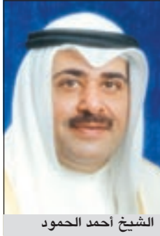
الشيخ أحمد الحمود

نحن مجموعة من وكلاء أوائل ضباط الصف العاملين بوزارة الداخلية والحاصلين على دبلوم بعد الثانوية العامة ناشد نائب رئيس مجلس الوزراء ووزير الداخلية النظر بعين الأب الحاني ورفع المعاناة النفسية عنا من أجل تعديل أوضاعنا الوظيفية وحصولنا على الحق في الترقية أسوة بزملائنا