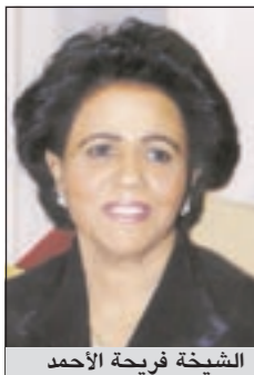
الشيخة فريحة الأحمد

أنا مواطنة كويتية، أضع مشكلتي ومأساتي بين يدي الكريمة بنت الأكارم «أم الكويت» وصاحبة القلب الكبير الشبيخة فريحة الأحمد الصباح لمساعدتي كوني أواجه ضائقة مالية ومديونيات تصل إلى 5 آلاف دينار، ولا يوجد معيل لي وفي رقبتي أنفس اعليهم رغم ما أعاني من ظروف قاهرة يصعب شرحها، حيث أواجه قضايا