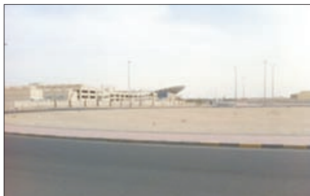
دوار يخلو من اللوحات الإرشادية