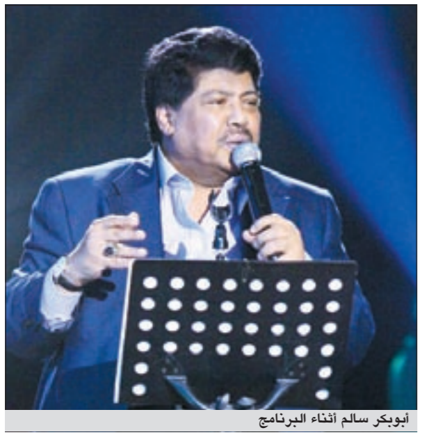
أبو بكر سالم أثناء البرنامج

وقالت غفران: قليلون من يغنون الأغاني الوطنية بصدق، وبعضها يصورها أشخاص غير مهمومين بصدق بحال البلد، لذلك لم تحقق أغلب الأغاني نجاحاً كبيراً، لكن أكثر ما يجعلني أشعر بغضب تعليل هيفاء وهبي على الأغاني