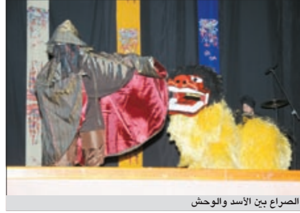
الصراع بين الأسد والوحش