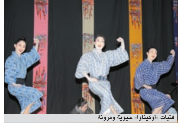
فتيات «أوكيناوا» حيوية ومرونة

الساحرة، حيث جاء العرض الراقص عبارة عن مسرحية استعراضية تحدثت عن مدينة هادئة تعيش بأمان تحت حراسة الأسود ليثور في يوم من الأيام أحد الوحوش فيها ويهدد سكان القرية المسلمين ليهب لمساعدتهم رمز الأسود «تُون تون» بعد أن قرعت الطبول لطرده هذا الوحش ليعود السلام لاهل القرية رغم محاولات ذلك الوحش النيل