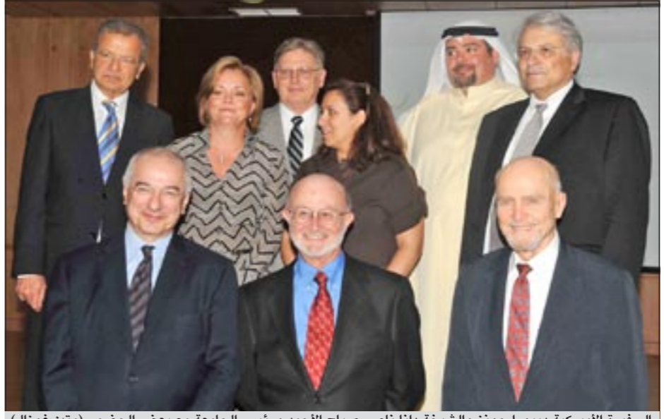
السفيرة الأميركية ديبورا جونز والشيخة دانا ناصر صباح الأحد ورئيس الجامعة مع بعض الحضور (متن غوزال)

تمنت السفيرة الأميركية في الكويت ديبورا جونز عدم تكرار استخدام إجراءات قاسية من قبل النظام السوري تجاه المواطنين لكنها في الوقت نفسه قالت: أنا اتفهم أن الرئيس بشار الأسد قد أعلن عن برنامج إصلاحي فعال والذي سيعمل على تحقيق مطالب السوريين المشروعة.