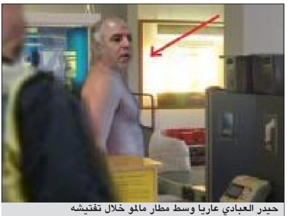
حيدر العبادي عارياً وسط مطار مالو خلال تفتيشه

تعرض أحد مسؤولي حزب الدعوة العراقي حيدر العبادي إلى عملية التفتيش العاري من قبل الشرطة السويدية في مطار مالو جنوب السويد اثناء توجهه الطائرة من بغداد إلى لندن الأسبوع الماضي، وذلك وفق ما نقله موقع المرابط العراقي بالصور. وأضاف الموقع العراقي ان حيدر العبادي احد قيادي حزب الدعوة الاسلامي والائتلاف الحاكم في العراق، تعرض للتفتيش العاري اثناء رحلته الـ VIP المتجهة من مطار بغداد إلى لندن، حيث طلبت الحكومة السويدية هبوط الطائرة داخل اراضيها بعد مرورها بالأجزاء السويدية لإجراء عمليات تفتيش على ركبها وعلى الحقايب في الطائرة باستخدام الكلاب البوليسية وفقاً للموقع.