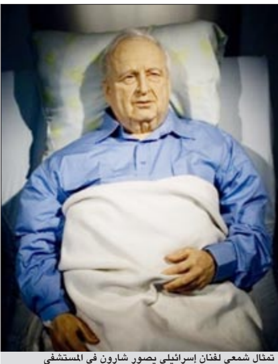
تمثال شمعي لفنان إسرائيلي يصور شارون في المستشفى

كشفت مصادر مطلعة في مستشفى «هداسا» الإسرائيلي أن الأطباء اضطروا إلى استئصال أجزاء من أمعاء رئيس حكومة إسرائيل الأسبق أرئيل شارون بعد إصابتها بالعفن والغرغرينا. وذكرت وسائل الإعلام أن الأطباء في مستشفى «هداسا» الذي يرقد فيه شارون في غيبوبة كاملة، قد أدخلوه غرفة العمليات من أجل إجراء جراحة عاجلة لاستئصال أجزاء من أمعائه التي تعفنت جراء إصابته بالغرغرينا.