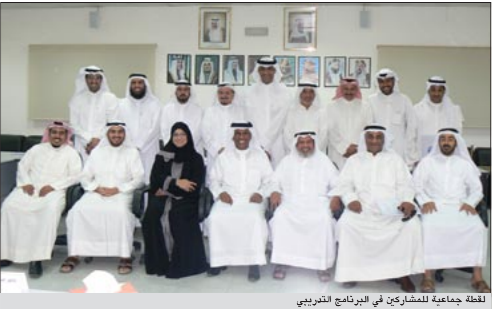
لقطة جماعية للمشاركين في البرنامج التدريبي