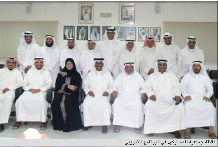
لقطة جماعية للمشاركين في البرنامج التدريبي

وقد قام رئيس جمعية المحاسبين د.رشيد القناعي بتكريم عدد من المحاضرين الذين قاموا بتدريس الأجزاء الخمسة من البرنامج التدريبي موجها الشكر إليهم على ما بذلوه من جهد مميز على مدار فترة عقد البرنامج التدريبي.