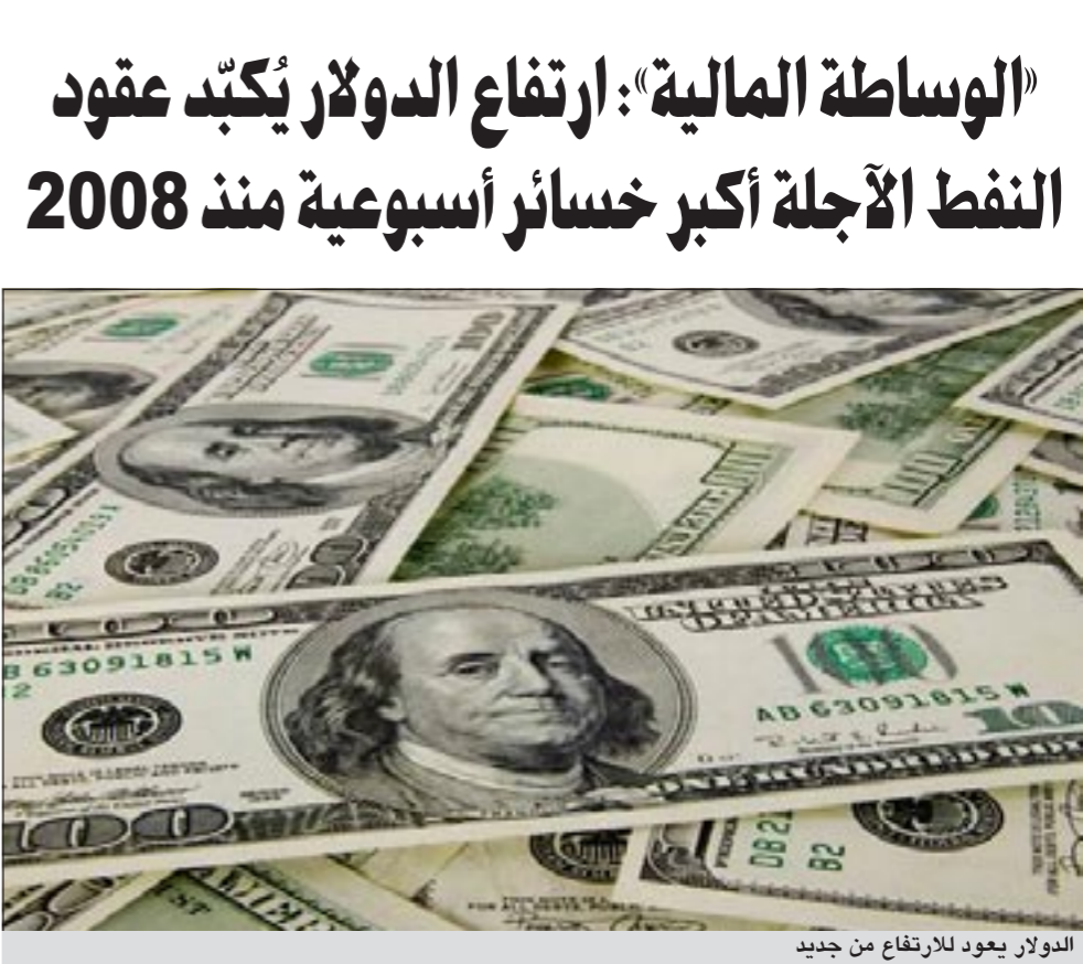
الدولار يعود للارتفاع من جديد

قال التقرير الاسبوعي للمجموعة الدولية للوساطة المالية في رصده لحركة أسواق المال العالمية، ان الارتفاع الذي شهدته اسعار صرف الدولار خلال الاسبوع الفائت، دفع عقود النفط الامريكي خلال معظم ايام الاسبوع الى التراجع، حيث هبطت اسعار العقود الآجلة للنفط الاميريكي لخامس جلسة على التوالي يوم الجمعة منيئة الاسبوع على أكبر خسائر من حيث القيمة بالدولار منذ بدء تداول النفط في سوق نيويورك التجارية (نايمكس) في 1983 بعد ان دفع صعود العملة الأمريكية للمستثمرين الي مواصلة مبيعاتهم في اسواق السلع.